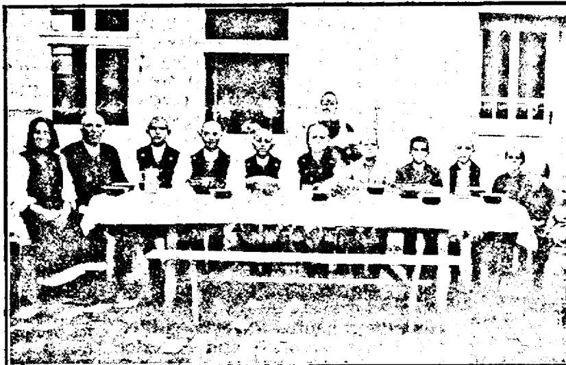
Orfelinațul din Prillpeș

Baptiștii americani nu se îmbulzesc la amvon. Dacă nu au predicator, nu țin serviciu sau oră de rugăciune. Membrii nu se simt vrednici sau capabili să țină un serviciu divin. De aceea sunt biserici unde nu se ține serviciu, decât la două sau trei Duminici, când vine predicatorul. M'am gândit ce deosebire e între ei și unele din bisericile noastre (Continuare în pag. 5-a)