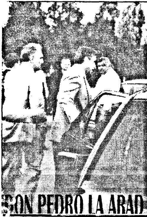
DON PEDRO LA ARAD

Actuala grijă a guvernanților este, după cum se poate citi cu ochiul liber, aranjarea paielor în ochii alegătorilor sau mai exact "coafarea" apropiatelor alegeri. Nici contestațiile, nici cărțile de alegător, nici clipurile electorale S.F. difuzate de unele posturi de televiziune nu au mișcat prea mult opinia cetățeanului de rând. Căci dacă la alegerile din Grecia se