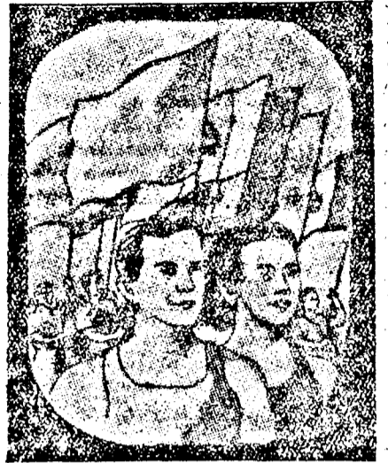
A Munkásifjúsági Kupa döntői 1949 augusztus 5-6-7

A svéd stafétában Temesvár csapata 2 p. 36.8 mp.-es idővel győzött, a balkán váltóban pedig Brassó 3 p. 35 mp.-el végzett az első helyen. Az 1500 méteres szeptor síkfutásban az ifjúsági Dumitrache győzött 2 p. 05 mp.-el, az 1500 méteren pedig a kolozsvári Mentzler (aradi származásu) nyert 4 p. 21.2 mp.-el. A pontversenyben a Temes tartomány nyert.