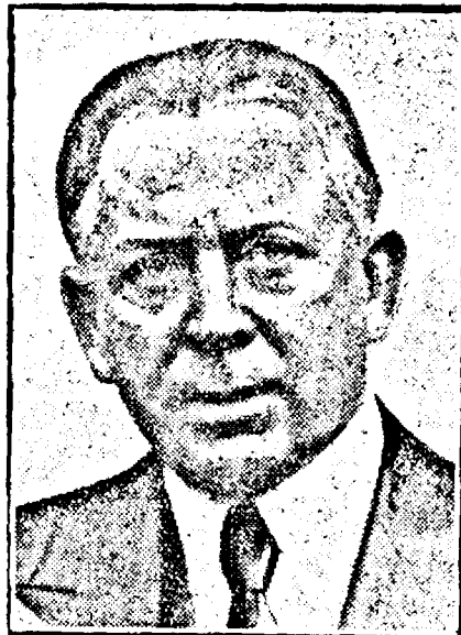
D. Octavian Goga Președintele Consiliului de Miniștri „Președintele consiliului român a declarat că problema

D. Octavian Goga, președintele consiliului de miniștri, a acordat un interviu, corespondentului la București al ziarului „Le Journal”: