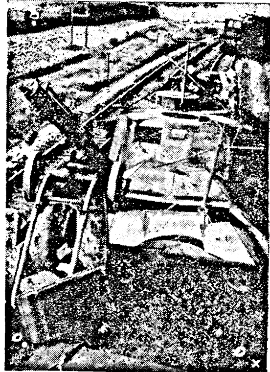
Un tren blindat sovietic distrus de forțele germane. (PR Ob)