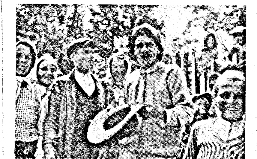
De pe frontul din Est. Prin reatră truțelor germane de către populația ucraineană. (PK Ob)

Se aduce la cunoștința tuturor refugiaților bucovineni și bucovineni: ca să depună cererile de repatriere la Prefectura Județului Arad, Camera No. 8. Cererile vor fi însoțite în lămurile posibilităților de următoarele acțiuni: 1. Certificat de Naționalitate sau orice alt act prin care să se poată dovedi naționalitatea. Acesta este indispensabil. 2. Pentru reprezentanții sau defecți salariați ai firmelor sociale sau individuale, o declarație a întreprinderii respective prin care să garanteze moralitatea, onestitatea și sentimentele patriotice ale solicitanților. 3. Pentru comercianții refugiați, dovadă că au avut firmă înscrisă în acel teritoriu. 4. Pentru comercianții sau persoanele care doresc să întemeieze o firmă comercială, o recomandare din partea Camerei de Comerț și Industrie, ori dela doi membrii ai Camerei de Comerț respective, vizată de Camera de Comerț. 5. Pentru agricultorii, dovadă că au fost proprietari sau că pe timpul refugiatului au exercitat această profesie și unde. 6. Autoritățile vor da toate acțiunile și vizele necesare solicitanților fără nici un fel de taxe și fără timbre. Model de cerere se află la Prefectura Județului Arad, Camera No. 8, Chestura Poliției Arad, Primăria Municipiului Arad, Biroul Refugiaților și Legiunea de Jandarmi Arad, și la toate primăriile din județ.