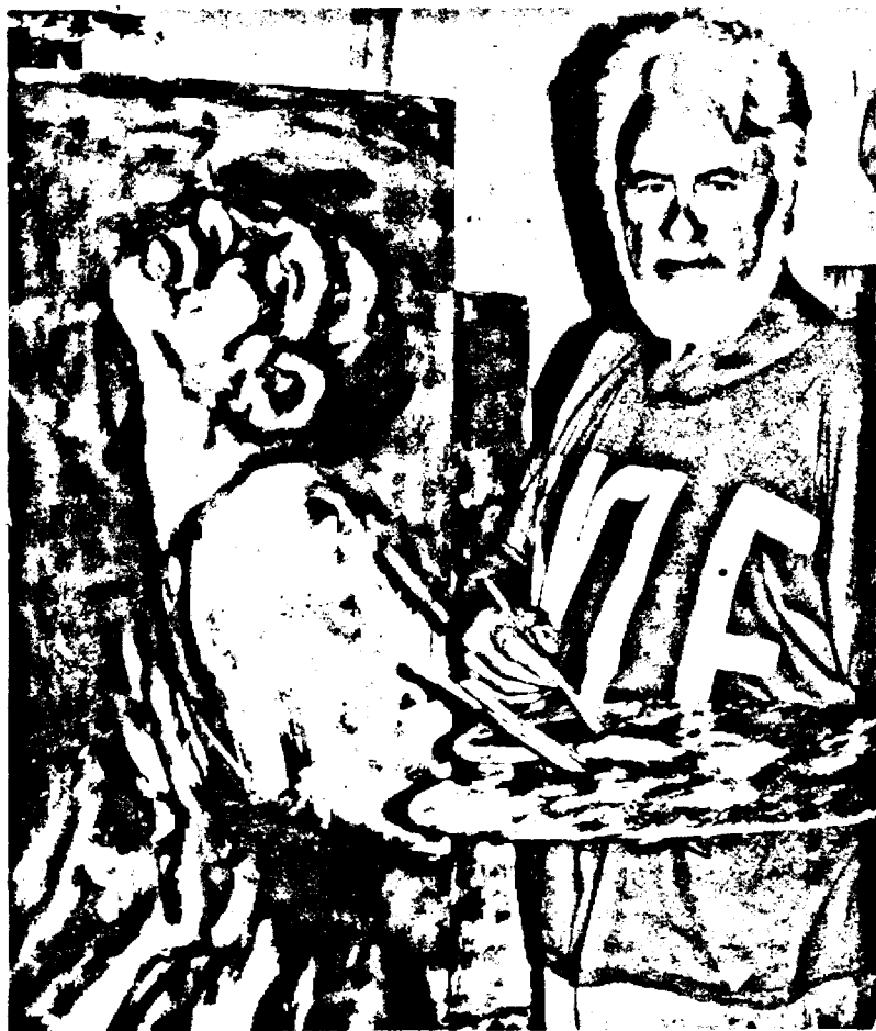
Pictorul în atelier