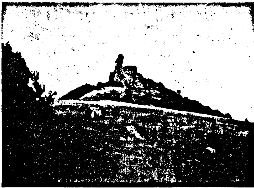
Ruinele cetății Șiria