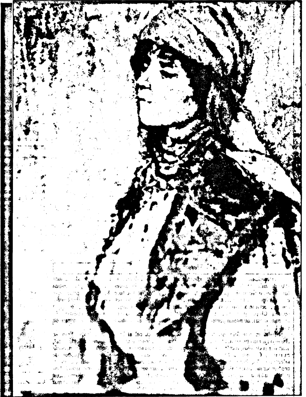
"Portret" - pictură de Francisc Baranyai