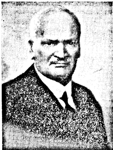
D. ȘTEFAN CICIO-POP

dealului cu Țara mamă. Cetatea Marelui Voievod Mihailu, a avut pentru prima și