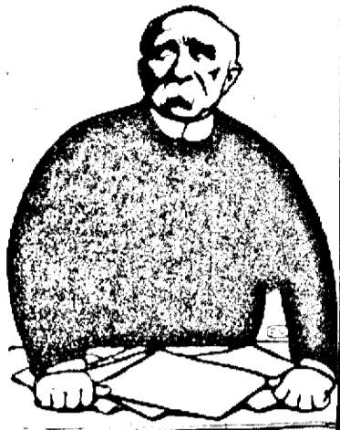
Clemenceau la tribuna (Desen de Valloton)