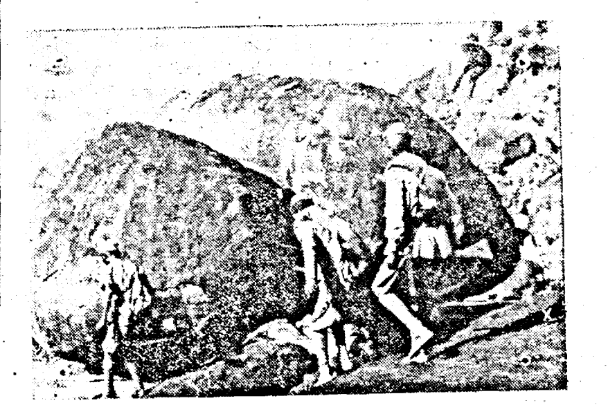
Trupele ind gene ale armatei italiene pe frontul din Kenia