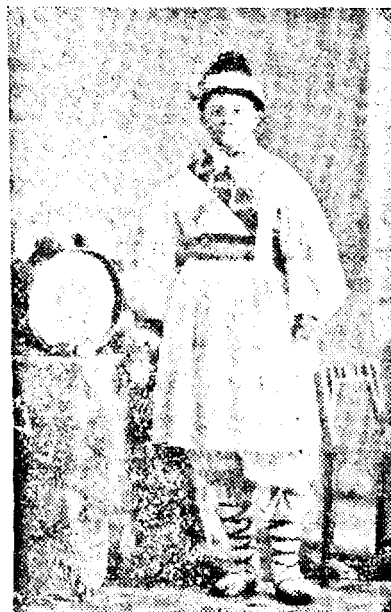
Tobașul echipei de colindători