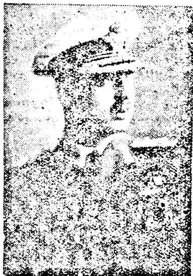
M. S. Regele Carol II-a

Mântuitorul nostru a creiat condiții fundamentale de viață, pe care nu le poți abandona fără să nu cazii în dezastru.