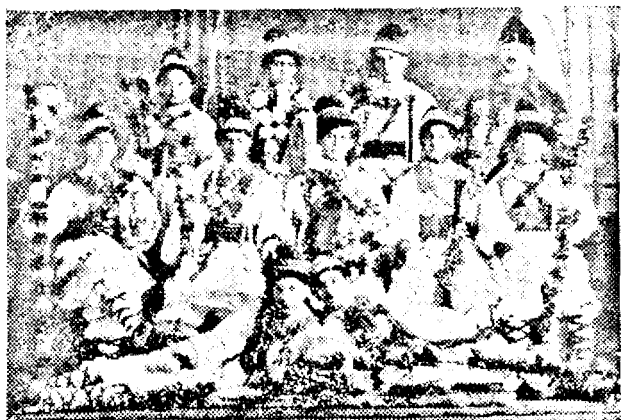
O echipă de colindători din Timișoara-Mehala