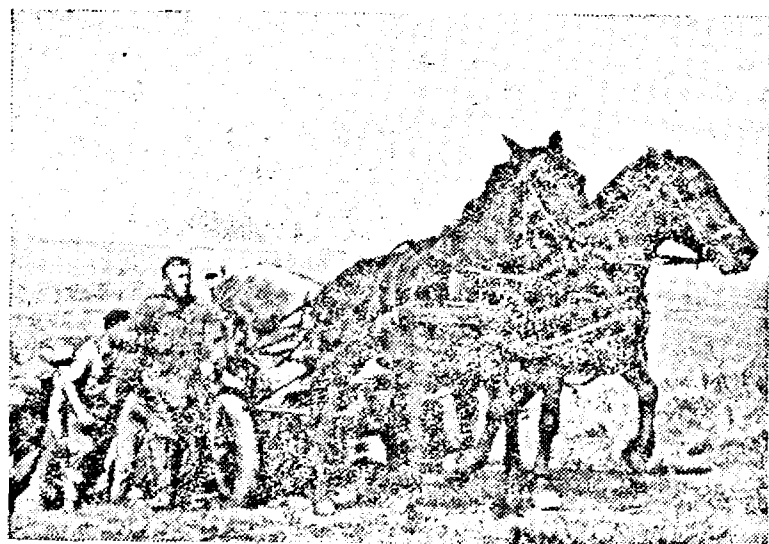
O baterie germană înaintează pe drumurile Ucrainei.