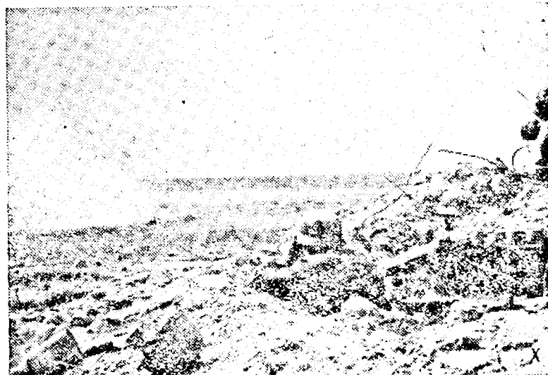
o baterie germană antiotr în luptă pe frontul de Est. (PK. Ob.)