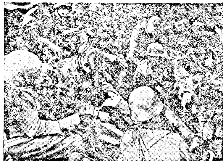
La postul de comandă al unui batalion german, comandanții de panii primesc instrucțiuni pentru acțiunea contra Petersburgului.

Pentru o mai eficace valorificare a recoltei de porumb, Bulgaria a instalat cu mașini germane câteva fabrici din porumb. În aceste fabrici, din porumb se obține 81% făină, 12% germeni, 5% țărăță și 2% rămășițe. Din 100 kg porumb încolțit se obțin 25 kg. ulei de porumb, din care se poate obține nutreț pentru vite. Bulgaria poate obține 440 tone mălaiu, 1 mil. hectolitri de untdelemn și 40 tone de turte. (RDV)