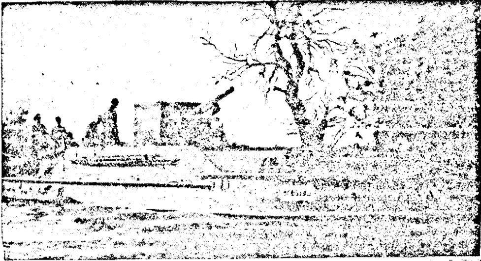
Canonieră germană patrulează pe Pripeț.