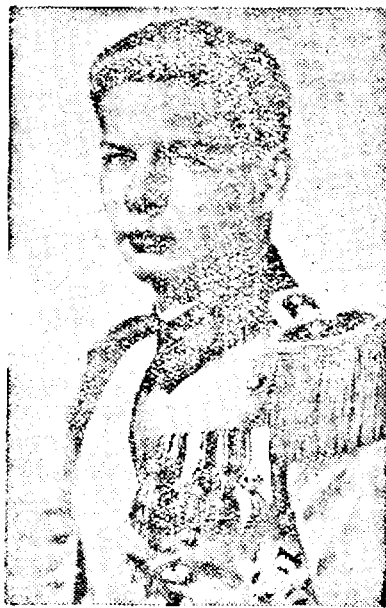
M. S. Regele Mihai I.

citor își trimetea razele sale ca o binecuvântare pentru