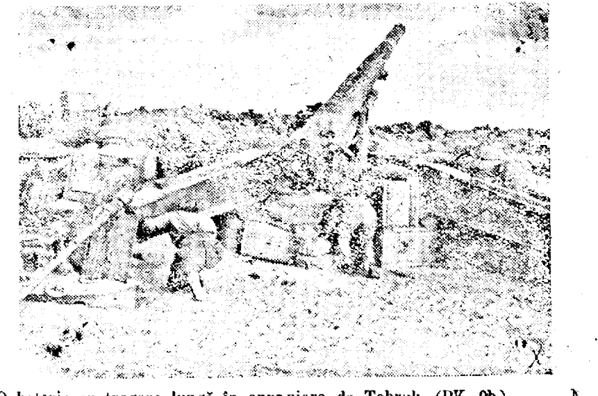
O baterie cu tragere lungă in apropiere de Tobruk. (PK. Ob.)