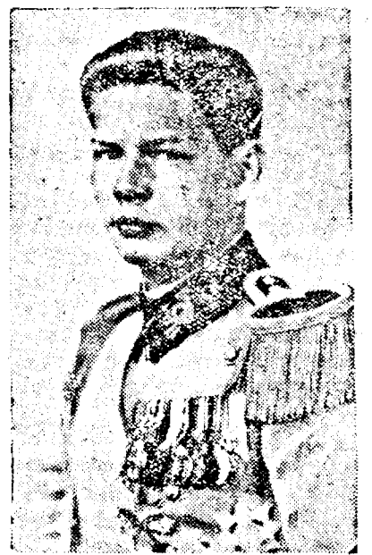
M. S. Regele Mihai I După ce M. Sa Regele și Conducătorul Statului au

lovituri de tun, întonându-se Imnul Regal.