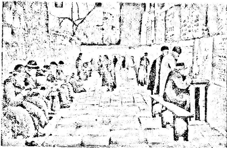
Fotografia noastră reprezintă un grup de evrei în timpul când își fac obicinuitele rugăciuni la Zidul Sfânt al Plângerei.

Se crede că delegatul Angliei pe lângă Liga Națiunilor va face declarații asupra situației din Palestina.