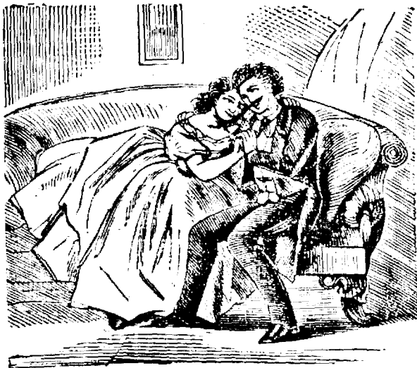
3. Mirele nu pôte sê respundia cu destulu focu la amorulu miresei sale.