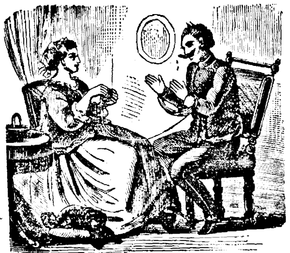
4. Amiculu familiei face tôte pentru fericirea amiculu seu.