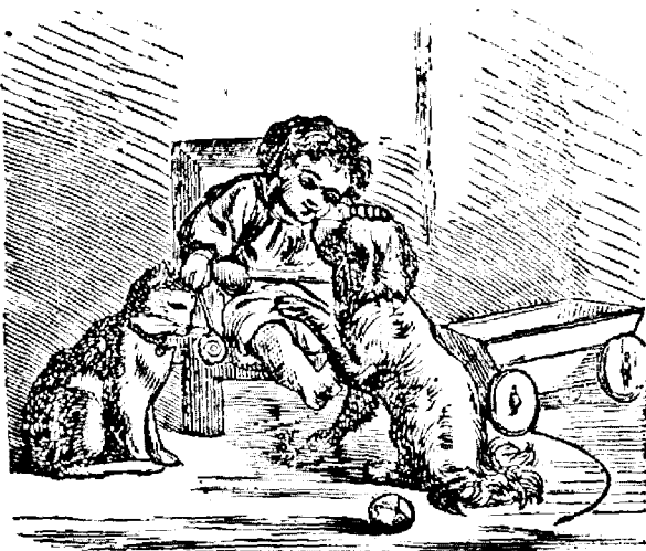
1. Amicii copilăriei petrecu timpul cu jocuri vială.