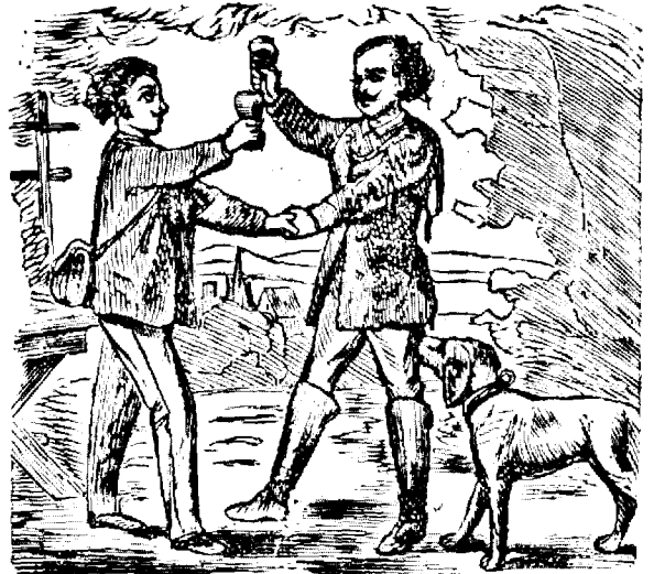
2. Amicii tineri și-jora amicéția eterna.