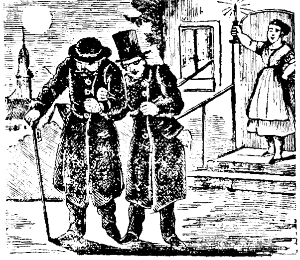
6. Amicii vechi și adevérati sê ajutóra unulu pe altulu.

Proprietariu, redactoru respundiatoriu și editoru: Iosifu Vulcauu.