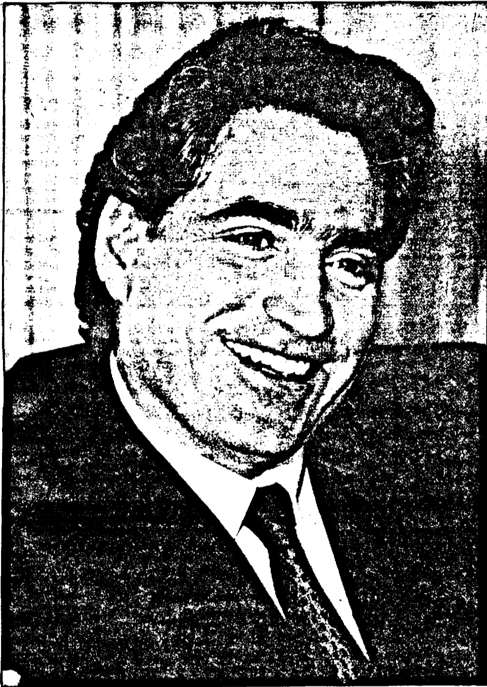
PETRE ROMAN, UN POTENȚIAL PREȘEDINTE AL ROMÂNIEI DE MÎINE