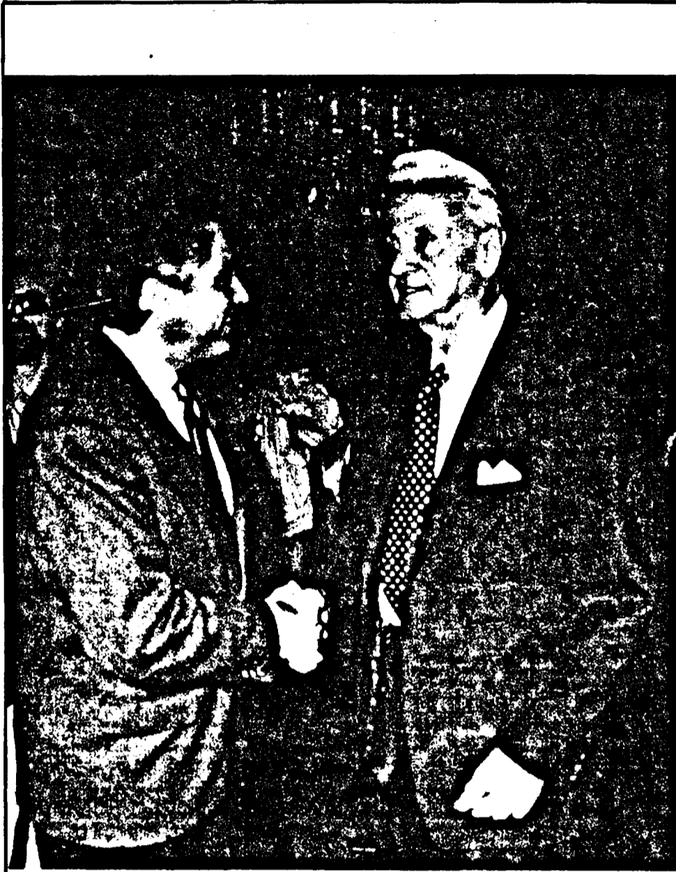
SERGIU CUNESCU ȘI PETRE ROMAN