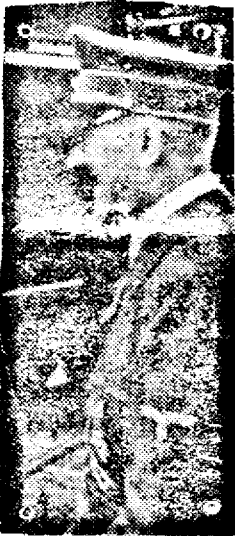
Führerul Adolf Hitler

in toate colțurile țării pentru domnia glorioasă a M. S. Regelui Mihai I, — pentru Care acest război este cel dintâi act al domniei Sale, — pentru generalul Ion Antonescu, conducătorul destinelor românești la glorie și desrobitorul fraților, și pentru ostașii, cari adunați în jurul Drapelului, au o deviză comună: CU DUMNEZEU ÎNAINTE PENTRU ȚARĂ ȘI REGE!