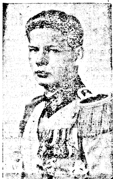
M. S. Regele Mihai I

dând trupele germane și române, luptând alături de madații săi, strajă neînfricată, Generalul Antonescu, coman-