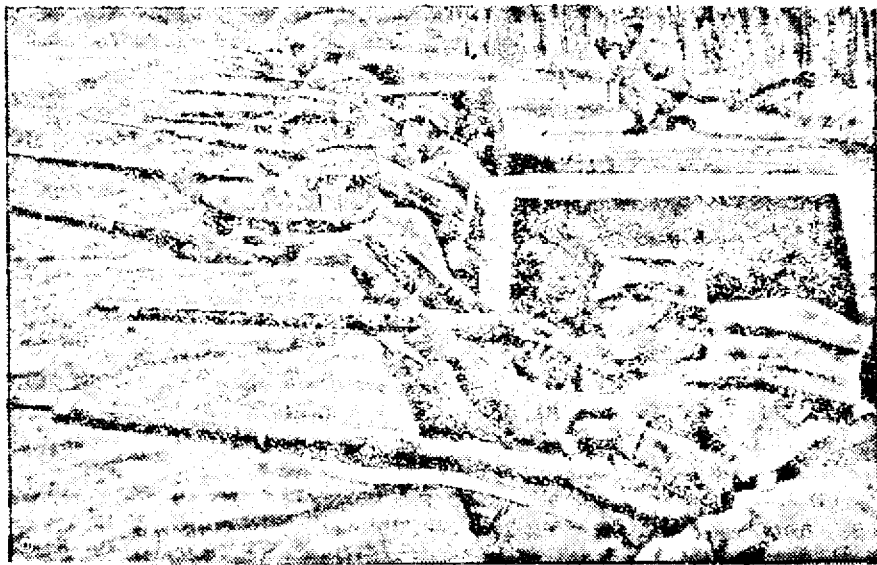
Fotografie originală din primele lupte: trupe chineze gata de luptă în primele tranșee.