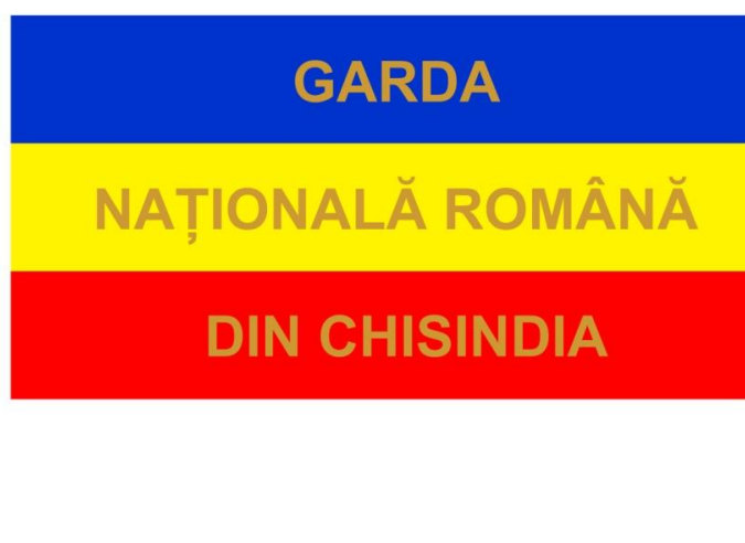
Fig. 1. Drapelul Gărzii Naționale Române din Chisindia. Reconstituire.

Inscripția aflată pe flamură indica denumirea formațiunii înarmate căreia i-a aparținut drapelul (gardă), caracterul (națională), componența ei din voluntari în baza etniei (română), și numele localității unde aceasta își desfășura activitatea (Chisindia). Prin această inscripție, drapelul acestei gărzi se individualiza între celelalte steaguri tricolore folosite și îi conferea acestuia calitatea de steag ostășesc. Inscripția de pe flamură era principalul element ce identifica drapelul, el devenind prin semnificația sa cel mai înalt însemn distinctiv al gărzii. Prin inscripția de pe flamură acest drapel era o particularizare a simbolului național la specificul ostășesc. La 1918, el simboliza lupta pentru libertate și unitate națională a poporului român la care participau și membrii Gărzii Naționale Române din comuna Chisindia. Inscripția aflată pe flamura acestui drapel prin conținutul ei prezintă un interes deosebit pentru vexilologia românească, deoarece tricolorul românesc ca însemn național a avut un rol important în contextul luptei pentru înfăptuirea Marii Uniri.