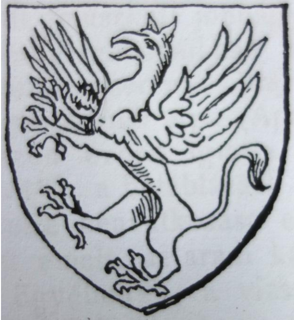
III. Stema Losonczy: scut francez medieval, triunghiular, cu flancurile rotunjite, încărcat cu un grifon 484 .