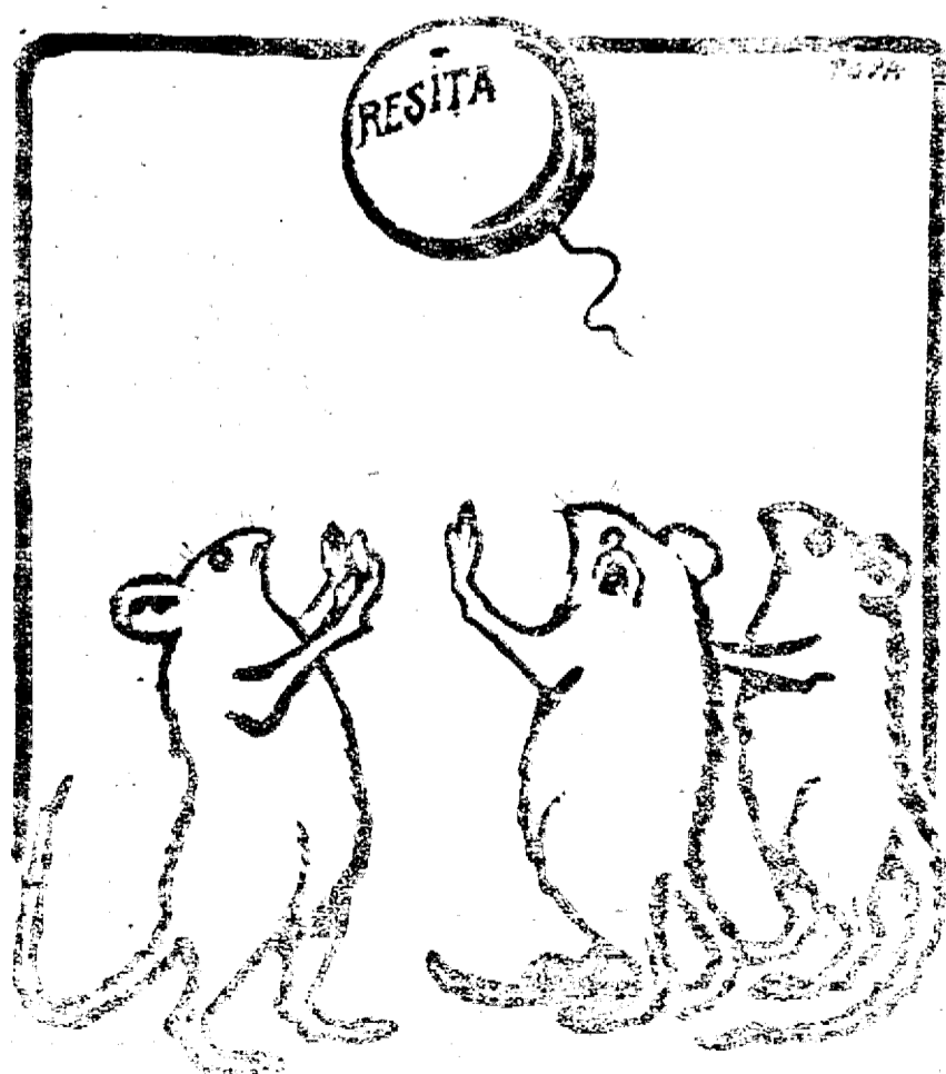
Steaua visurilor „noastre.”