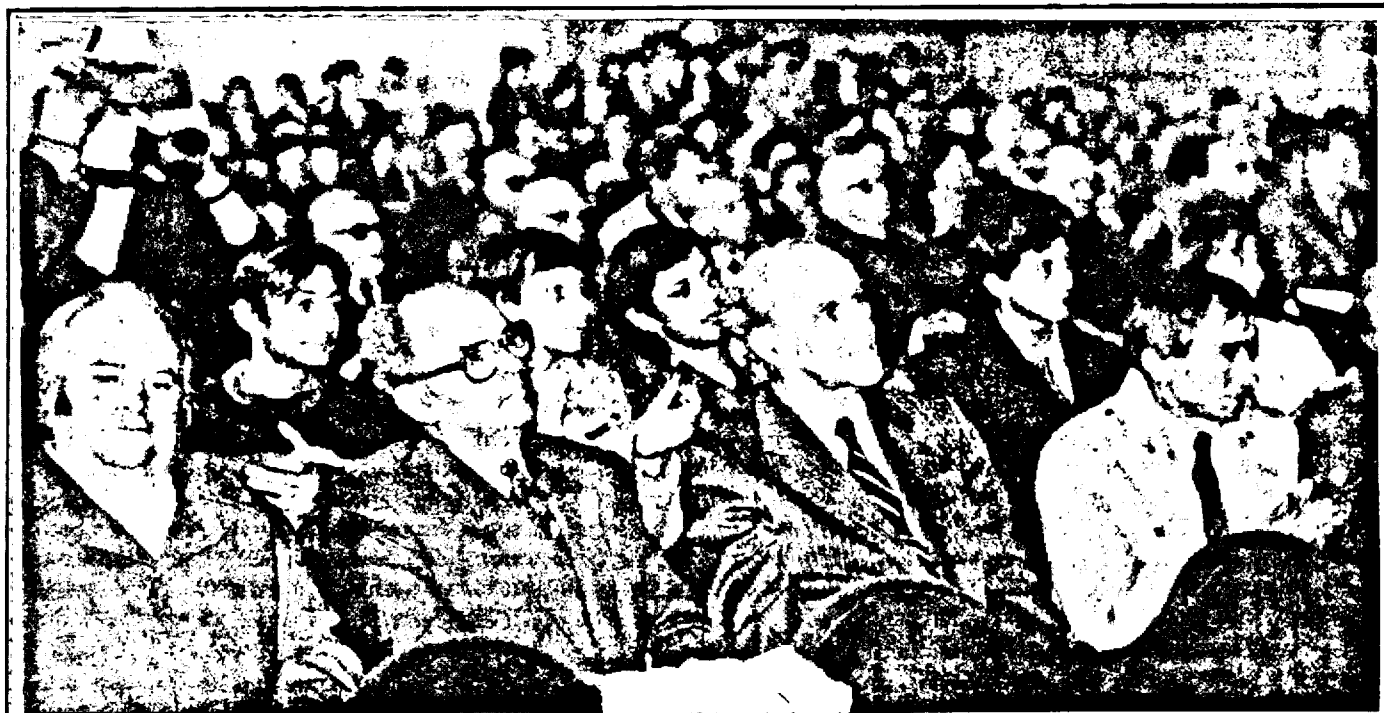
Aspect din sala festivă a liceului unde a avut loc adunarea omagială.

Academia Română i-a primit în rândurile ei și pe Caius Iacob, Aurel