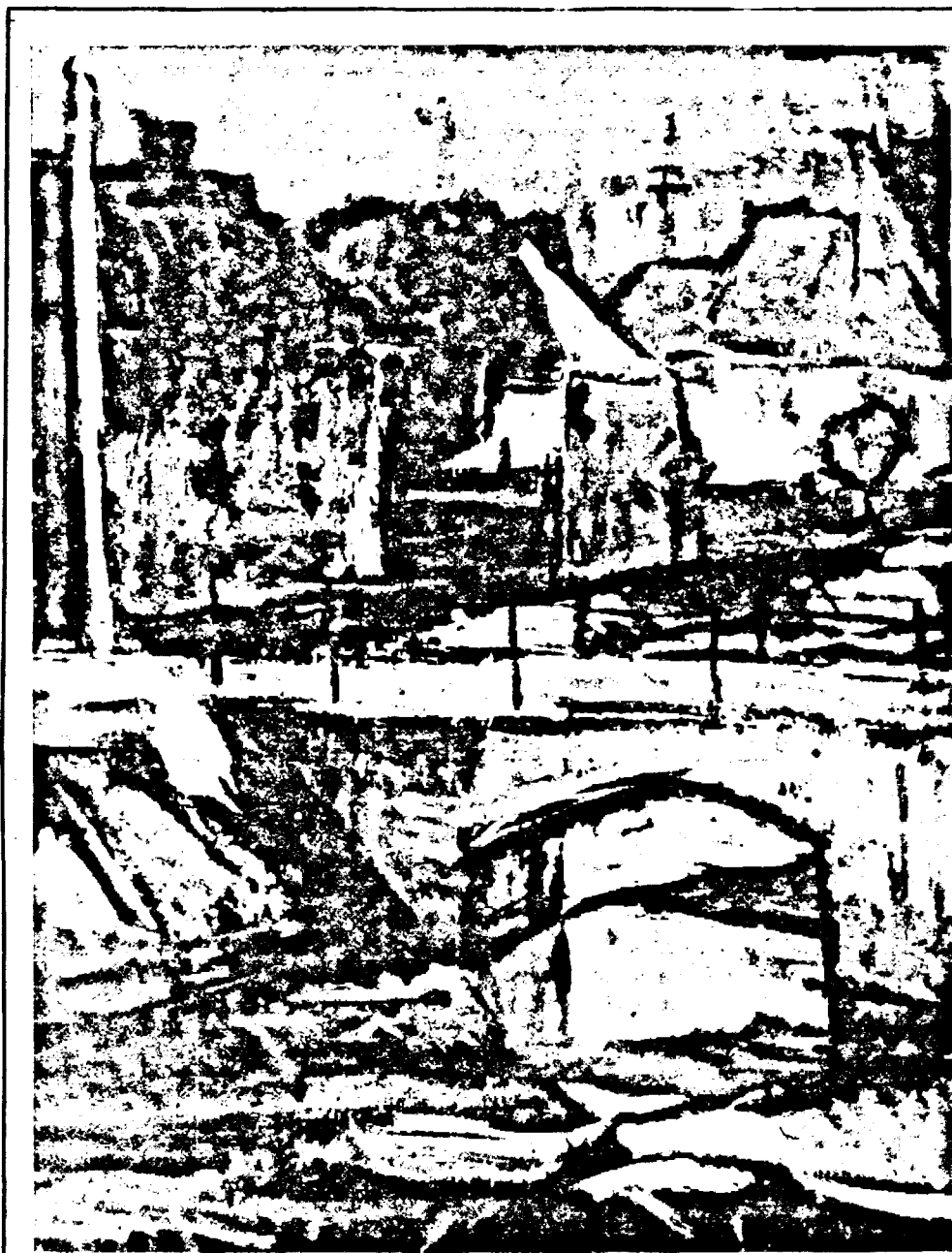
NICOLAE Chirilovici : „Peisaj citadin cu pod”