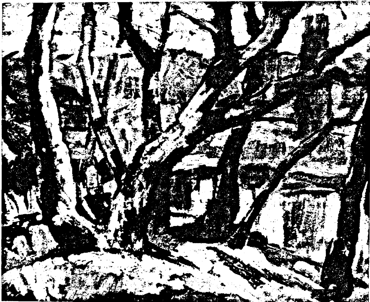
Nicolae Chirilovici „Trecerea anotimpurilor”