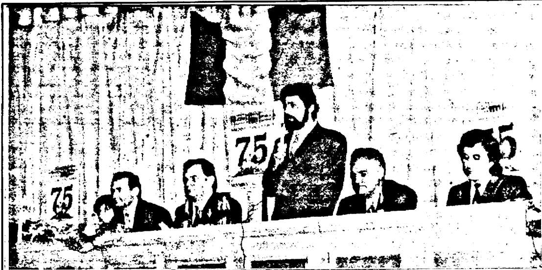
În prezidiul adunării omagiale conducerea liceului și oficialități arădehe.

Timp de cinci ani, între 1860 și 1865, Ioan Slavici - marele prozator