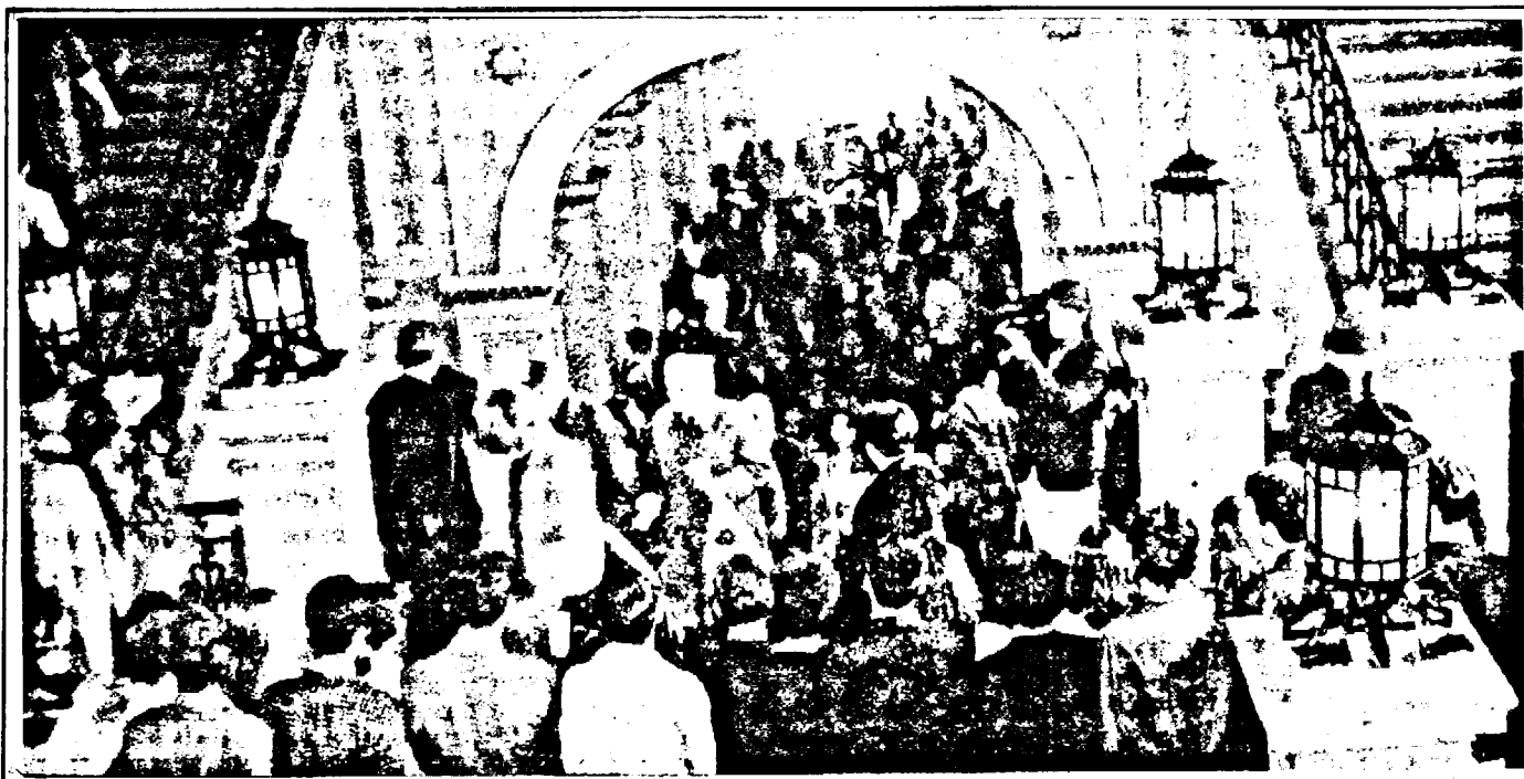
Moment emoționant : sosirea invitaților și foștilor elevi ai Liceului „Moise Nicoară” din Arad.

Doar pasărea de gând ce-ar vrea s-ajungă legea luminii fără de pereche Cu fața soarelui în aripi vine încă trece prin ea, ca printr-o rană veche.