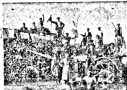
Cséplőmunkások ebédszünet közben.