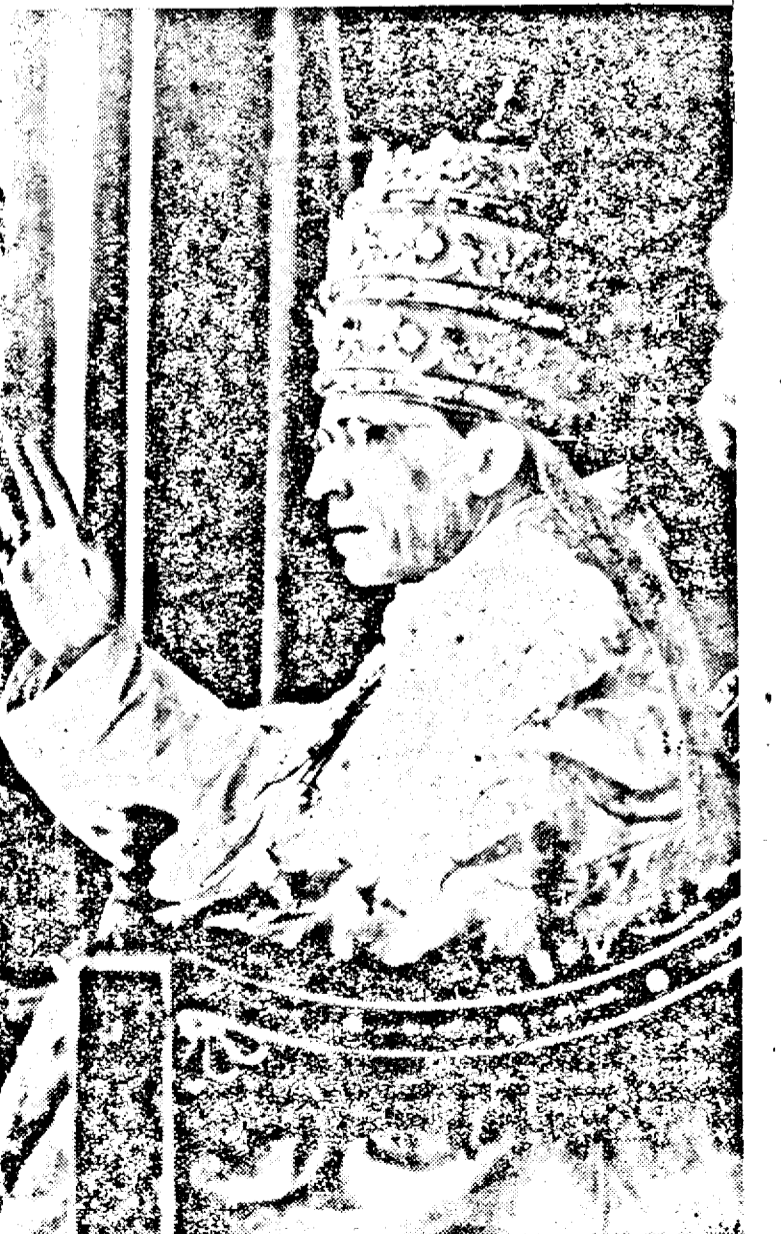
pa binecuvântând mulțimea cu ocazia aniversării