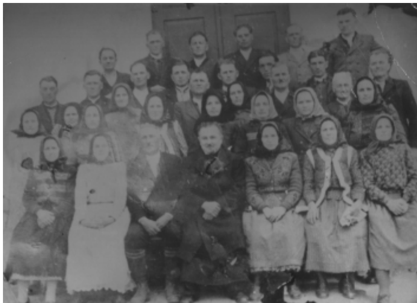
Corul bisericesc – 1955

în special le era interzisă construirea lăcașelor de cult din piatră sau din cărămidă. Din vechea biserică de lemn se pare că se păstrează unele icoane pe lemn încastrate în iconostasul actualei biserici. Existența vechii biserici este amintită în conscripția episcopului Sinesie Jivanovici care nota că la anul 1755 aceasta era veche și avea hramul „Bunavestire”. Aceeași conscripție amintește și biserica de lemn din Vânători care era mai nouă, fiind înălțată după refacerea satului distrus de curuții lui Rakoczy. Având hramul „Sf. Arhangheli”, aceasta a fost înlocuită cu actuala biserică de zid în anul 1829. 24