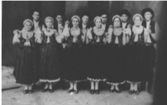
Formația de dansuri populare din Mișca la Casa de Cultură din Chișineu-Criș - 1975