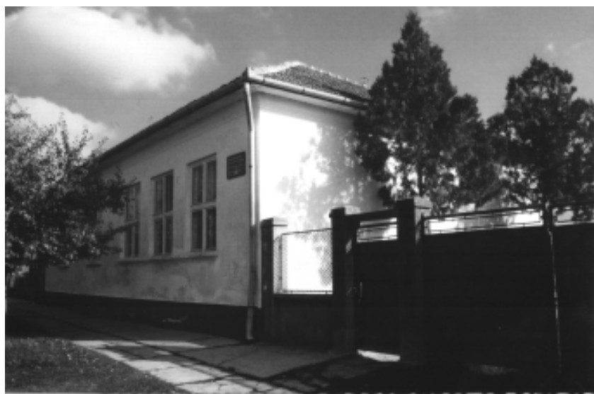
Vechea Școală Generală

nouă cu 8 săli de clasă, dotată corespunzător. Această școală va funcționa atât cu cadre didactice de specialitate, cât și cu suplinitori la unele discipline. În ultimii ani ai secolului XX, scăderea natalității precum și plecarea tinerilor spre orașe au determinat o scădere sensibilă a populației de vârstă școlară, fapt observabil din numărul relativ scăzut de elevi pe clasă și din compoziția etnică a acestora. Biblioteca școlii dispune azi de 250 de volume, în majoritate fiind vorba de titluri din bibliografia școlară și de material didactic în curs de reactualizare, conform cerințelor reformei din învățământ.