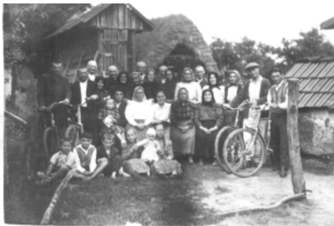
Membri bisericii pentecostale, la începuturi

Astăzi, această biserică are un număr de 35 de credincioși care frecventează casa de rugăciuni bine întreținută de la numărul 165 B. Activitatea bisericii adventiste se desfășoară pe baza autorizației de funcționare eliberate de Ministerul Culturii și Cultelor, bucurându-se astfel drepturile și protecția conferite prin legile statului.