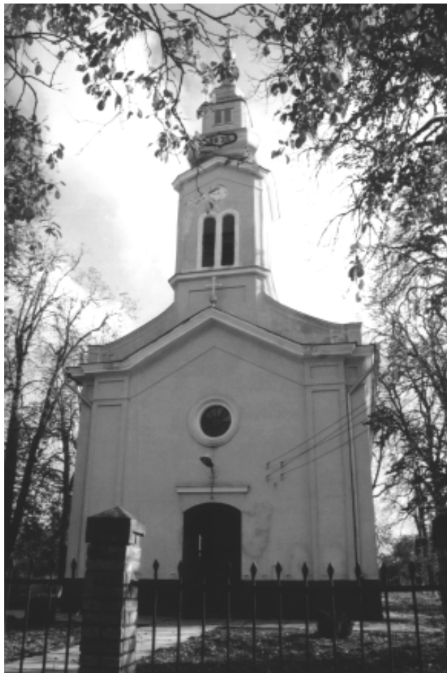
Biserica Ortodoxă actuală

până în anul 1930. odată cu acest an, în locul fostei școli a fost amenajată actuala casă parohială.