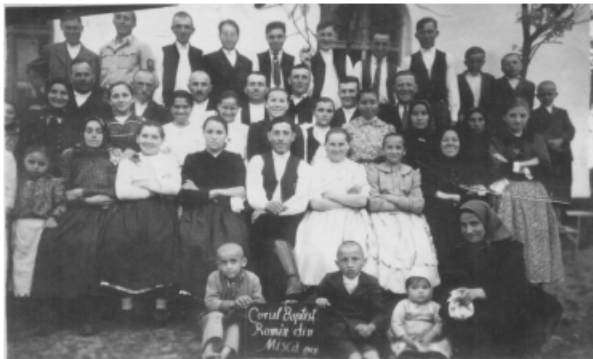
Corul bisericii baptiste – 1948

„simpatizanți”. Pentru aceștia, între anii 1925 – 1927 se construise o casă de rugăciuni cu o capacitate de 150 de locuri, aflată la actualul număr 120. Înființarea cultului și ridicarea casei de rugăciune fuseseră impulsionate de bapțiști veniți din Curtici și Salonta.