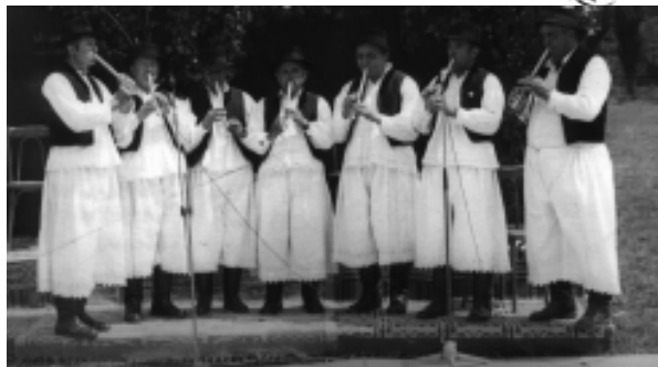
Formația de fluierași ai Căminului Cultural din Mișca – 1975