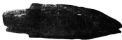
Vârf de săgeată

Al treilea punct numit „Dâmbul Cetății” este o movilă mai înaltă ce se aplatizează spre vest și cuprinde 7 straturi de locuire, cu mai multe niveluri culturale 30 . Așezarea hallstattiană a fost, probabil, părăsită din cauza inundațiilor. Peste nivelul hallstattian descoperit în toate cele trei puncte se află și urme de locuire dacică în două