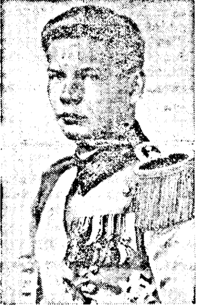
M. S. REGELE MIHAI I.

În cele ce urmează d. general Antonescu, conducătorul statului și președintele consiliului de miniștri, se adresează inimelor și cugetelor cetățenilor, cerându-le să dea pentru Patrie munca și fapta lor, precum și încrederea.