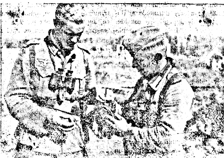
O mină sovietică, desfăcută de soldați germani.

cel mai mare magazin de fierărie, mașini de gătit, fabricație proprie, obiecte speciale de menaj. Arad, Piața AVRAM IANCU, lângă Zimmermann, magazin de piele