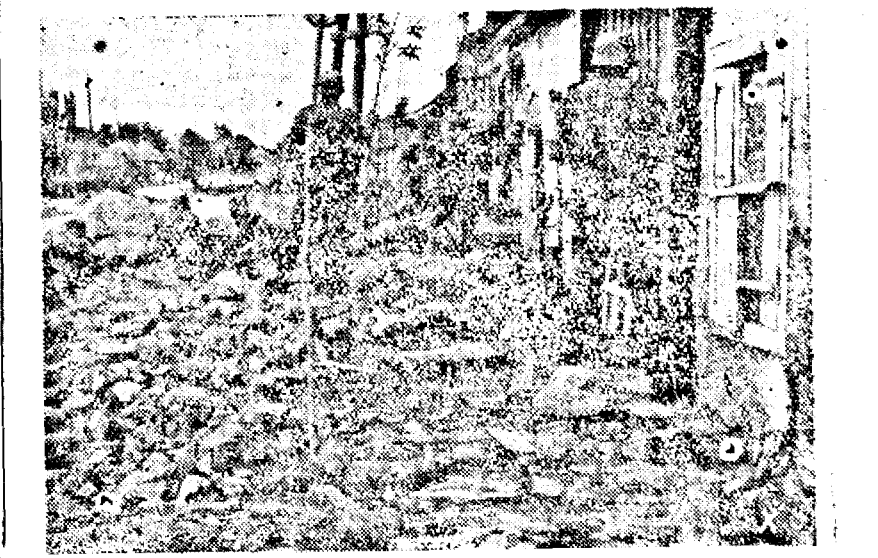
Lupie de stradă într'o localitate sovietică. (PK. Ob.)