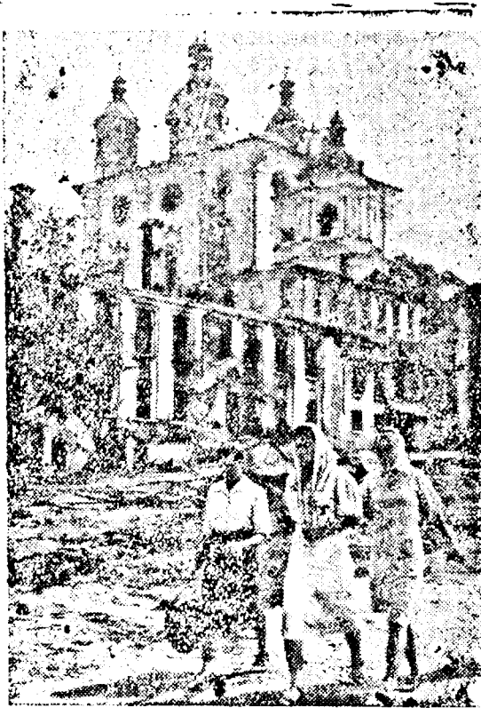
O parte a orașului Smolensk distrus de către sovietici. (PK. Ob.)