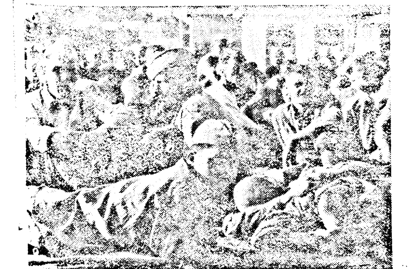
Una dintre sutele de mii de prizonieri bolșevici luați de trupele germane. (PK. Ob.)

În această chestiune odioasă s'ar conveni să se facă ordine, indiferent că cine este mijloc.