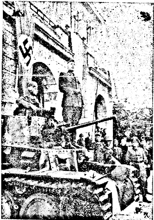
Intreaga Europă a mobilizat împotriva bolșevismului. Ministrul Apărării Naționale slovace vorbește trupelor de pe frontul din Răsărit (PK Ob)

Stockholm. — Corespondentul ziarelor suedeze din Londra transmite știrea că, probabil în cursul acestei săptămâni ministrul britanic Eden s'a ducă la Moscova.