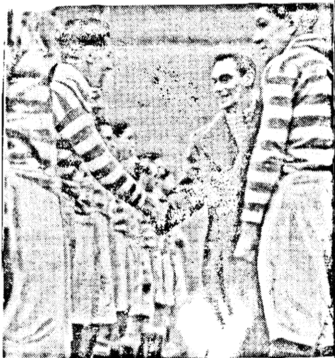
În Anglia rugby-ul este foarte popular. Regele al VI-lea e un fervent spectator și admirator al acestui sport și în fotografia de mai sus îl vedem strângând mâinile celorlalți membri ai familiei înainte de match.

Statele Unite, Canada, România, Germania și Japonia.