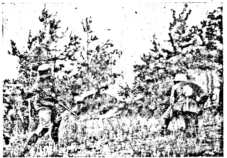
O luptă în fața unei fortărețe sovietice. (PK. Ob.)