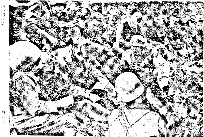
La postul de comandă al unui batalion german, comandanții de companii primesc instrucțiuni pentru acțiunea contra Petersburgului. (PK. Ob.)

S'A PRELUNGIT termenul pentru semnarea IMPRUMUTULUI REINTREGIRII, până la 1 Decembrie a. c.