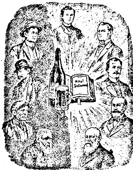
De care parte e locul tău ?

cari vor cădea toate asupra ta. Te rog scrie adânc în mintea ta că, Dumnezeu rabdă îndelung, nevrând moartea păcătosului, ci întoarcerea lui.