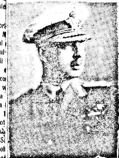
M. S. Regele Carol II-lea.

Țara întreagă se pregătea dela sărbătorească la mare, să sărbătorească la 8 Iunie, împlinirea unui deceniu, dela coborârea Marelui Mare Suveran în mijlocul poporului său.