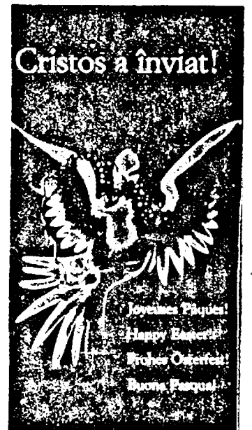
Redacția ziarului „ȘTIREA” urează tuturor creștinilor sărbătorii fericite!

Pagină realizată de DAN PĂRVULESCU