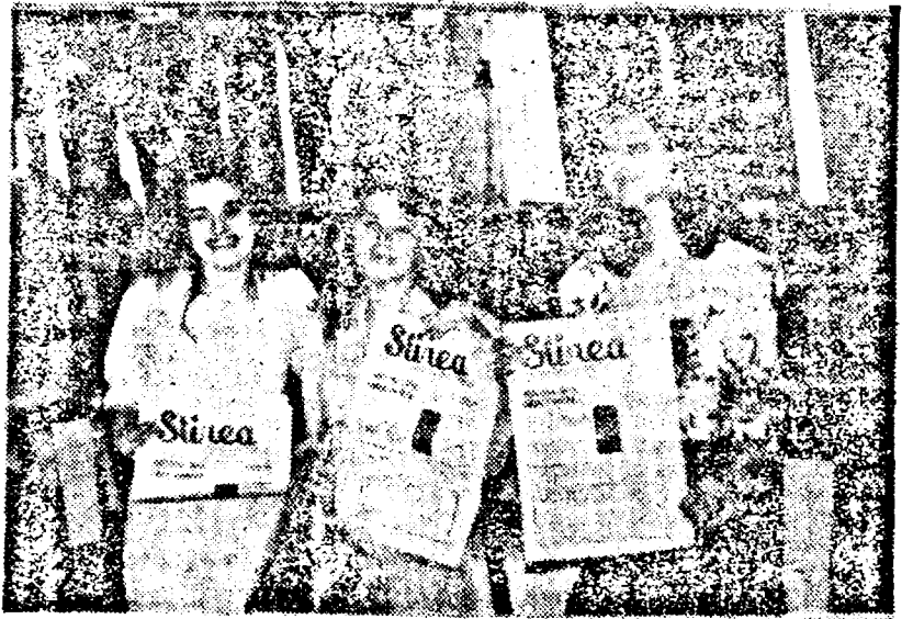
STARURILE CİNTECULUI ARĂDEAN, cu STARUL PUBLICISTICII ARĂDENE

„Mai fac o fotografie și plec urgent la Săvișin. Dacă ar fi fost transmise TV în direct, ai mei ar fi aflat deja. Acasă am să încep cu o curătenie generală în toată casa. Cînd mătur îmi place să cînt „Pașii mei”. Sper ca pașii mei să fie pași în doi pentru că individul trebuie să apară în viața mea. Îi simt pe-aproape, dar cred că-i un timid incurabil. S-ar putea să-l tratez