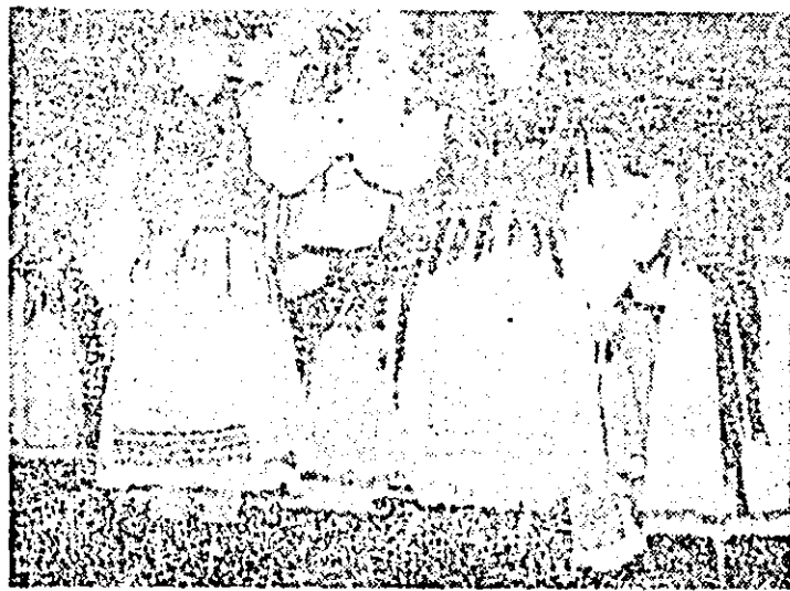
Recent, formaţii artistice pionieresti din Almas, Bellu, Caporal Alexa, Birzava, Boesig, Cermel, Dezna, Naduş, Petriş, Sebîş şi de la Şcoala nr 10 Arad au prezentat pe scena Casei de cultură a sindicatei un frumos „Festival al obiectivelor de lărmă”. ÎN FOTOGRAFIE: în spectacol, formaţia pionierilor din Almas.