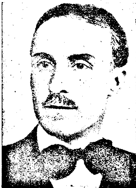
Teodor D. Iacobescu

ce în ce mai mari, ridicând prestigiul și importanța acestui corp de intelectuali, la înălțimi nebănuite. Vom sărbători pe ministrul subsecretar de Stat al Educației Naționale, Domnul D. V. Țoni , care a știut să scoată la lumină misiunea și valoarea învățătorului român, din întunerecul în care fuseseră aruncate de către politicianismul dinainte de 1938.