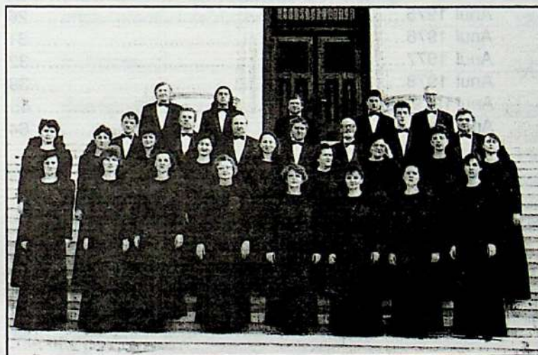
Corul "Emil Monția" din Arad - 1998