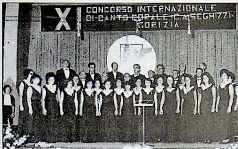
Corul "Emil Monția" la concursul internațional de la Gorizia (Italia) - ediția a XI-a - 1972