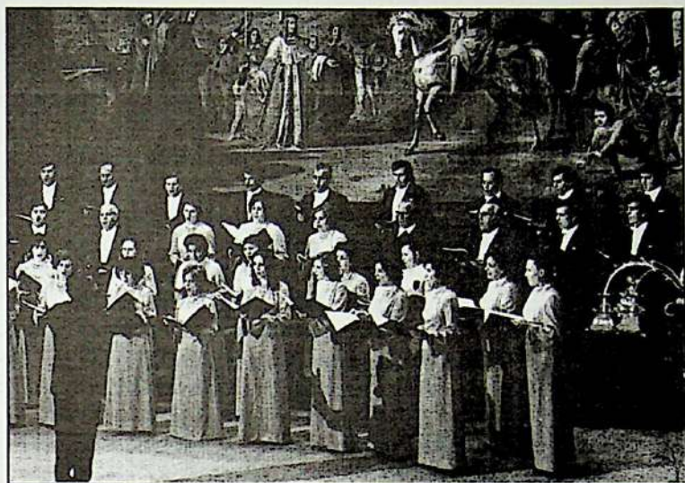
Corul "Emil Monția" pe scena Teatrului "Petrarca" din Arezzo, Italia - 1977