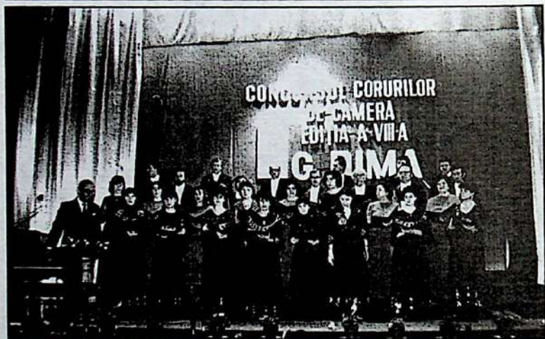
Corul "Emil Monția" la concursul corurilor de cameră "Gh. Dima" - ediția a VIII-a de la Brașov - 1988