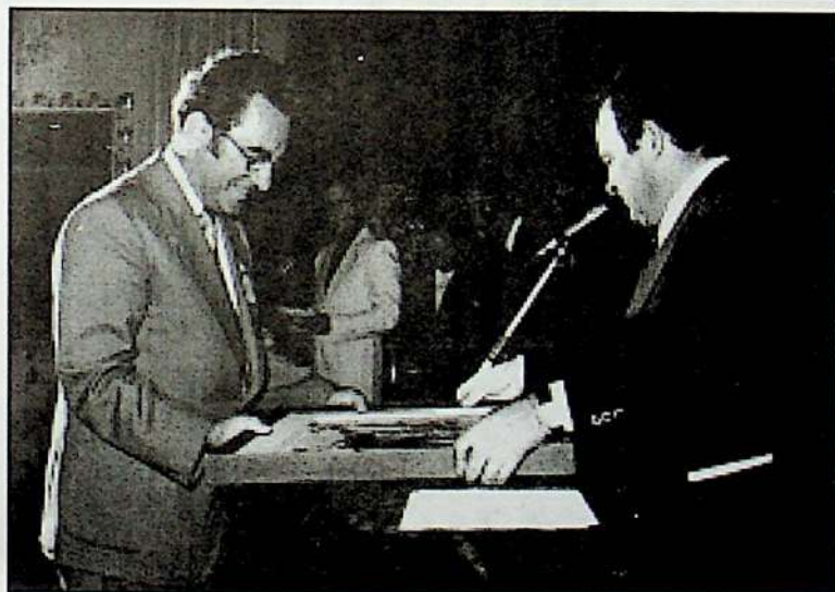
Dirijorului Gheorghe Flueraș primește o distincție la Arezzo (Italia) - 1977