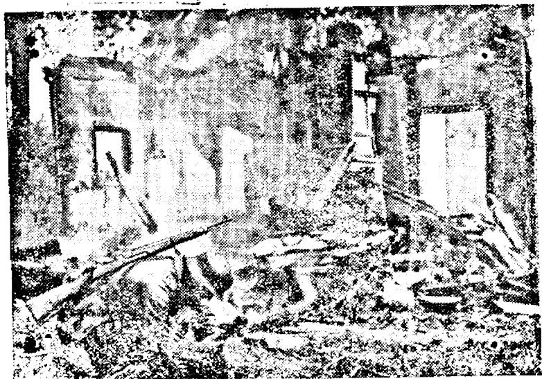
In totul luptei un telefonist german reface linia întreruptă. (PK Ob.)

tele ad-interim al consiliului de miniștri. Textul Decretului-Lege este mează să fie dat publicității.