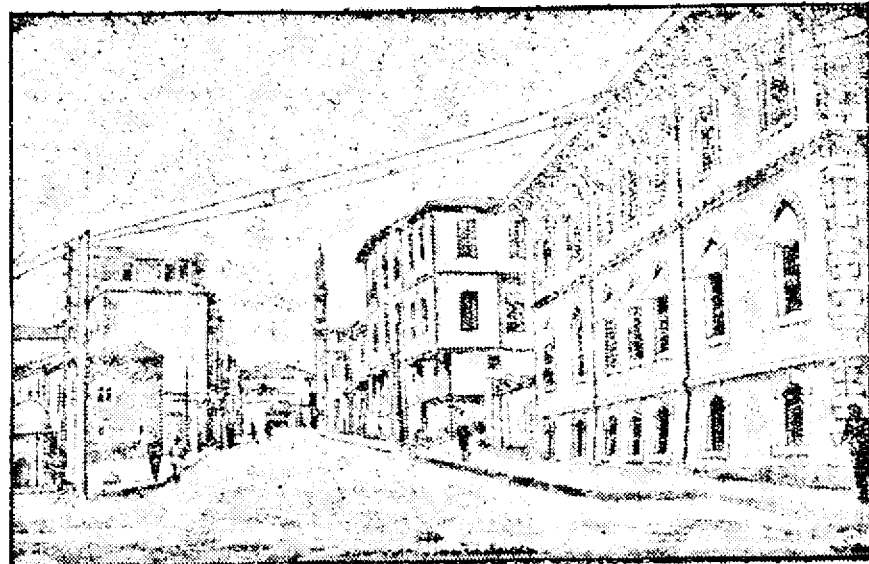
Clișeul nostru reprezintă una Angora, unde în zilele trecute un din principalele străzi ale capitalei incendiu a făcut mari ravagii.