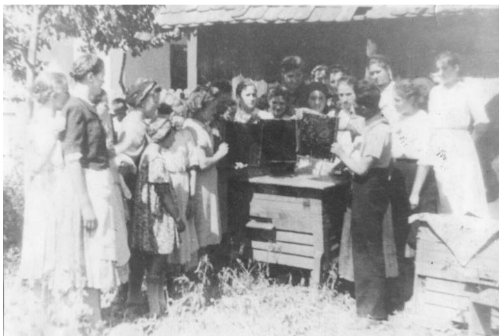
Înșușirea unor cunoștințe de apicultură