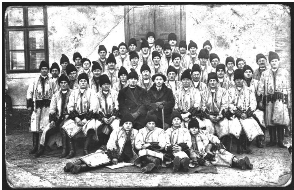
Corul din Covăsânț în 22 feb. 1937