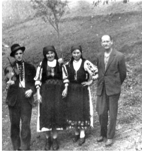
Cu moșii în Munții Apuseni

În timp, a publicat numeroase articole pe teme muzicale în reviste de specialitate. A publicat două cărți, care vor ajunge de referință pentru toți cei interesați de folclorul muzical al podgoriei și părților arădene: Folclor muzical