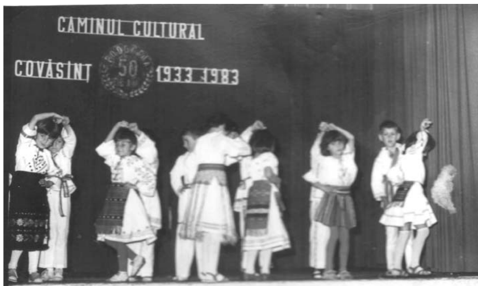
Formația de dansuri a școlii

De asemenea a fost absolut obligatorie participarea la învățământul politic-ideologic de la nivelul școlii. Referințele privind participarea la activitatea politică, obștească, artistică constituiau condiții pentru calificativele anuale