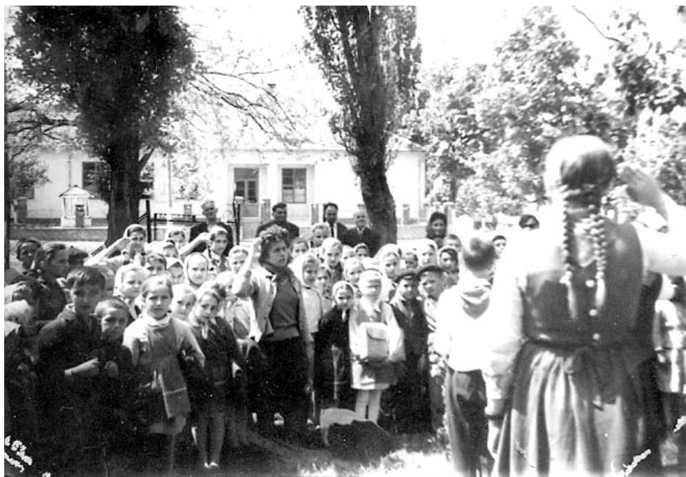
Pionierii școlii din Covăsânț