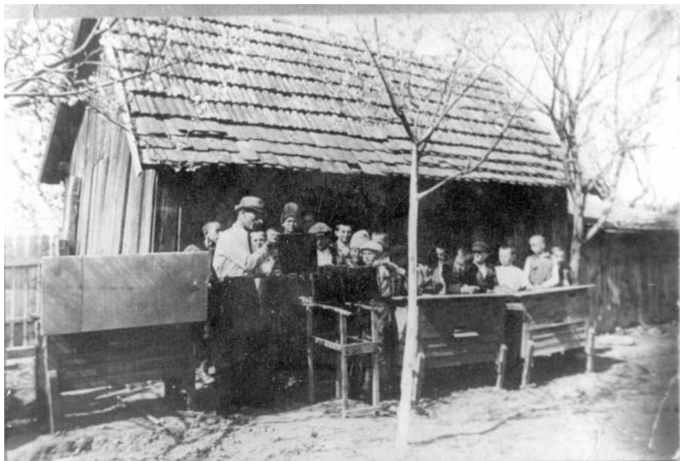
Înșușirea unor cunoștințe de apicultură