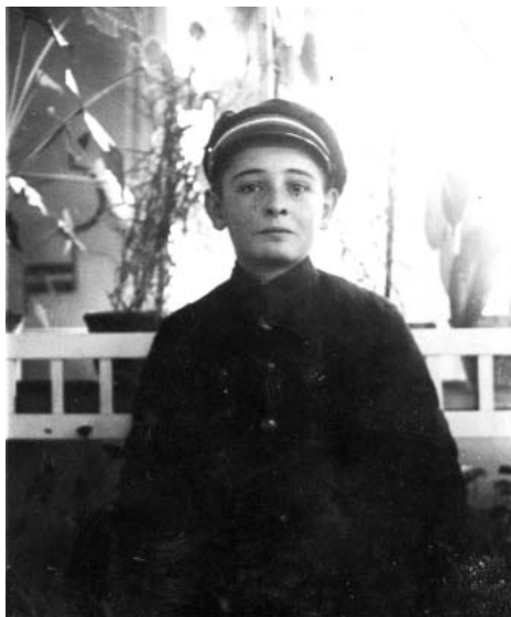
Elev la școala Normală din Arad. 1934