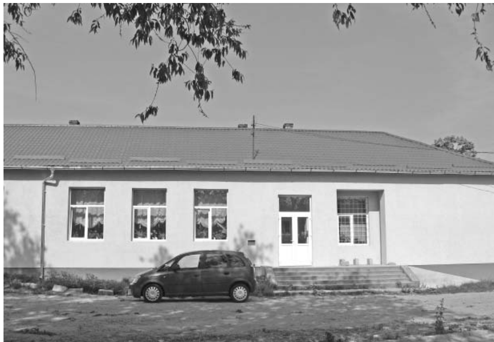
Vechea clădirea a școlii renovată