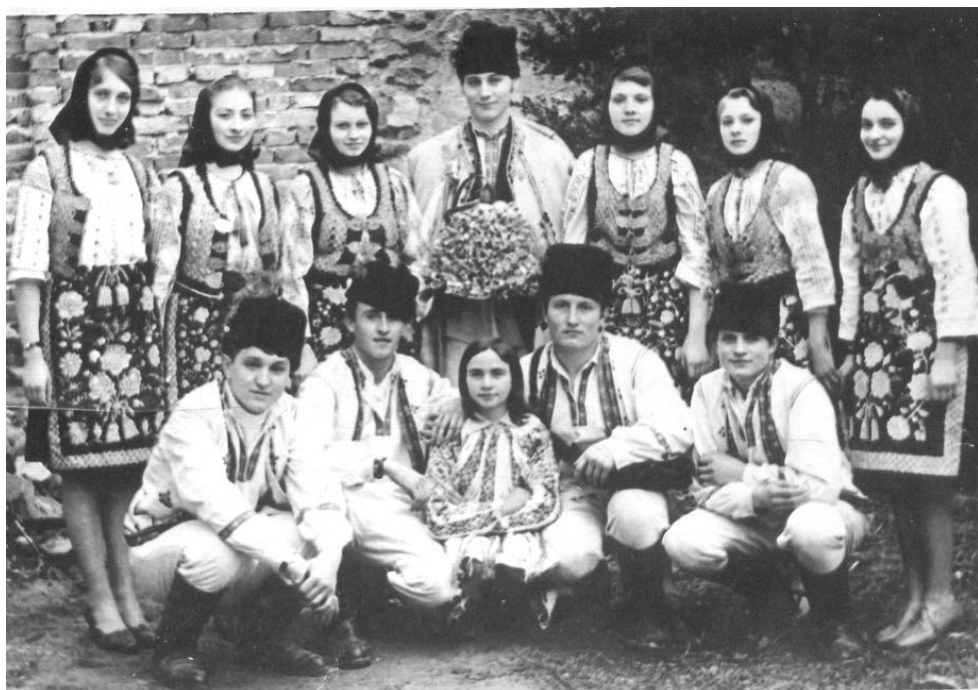
Formația de dansuri din Covăsânț 1973