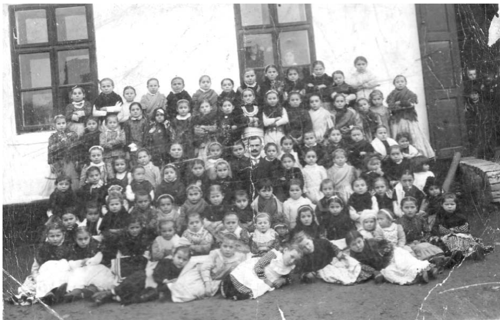
Elevii școlii din Covăsânt în perioada interbelică