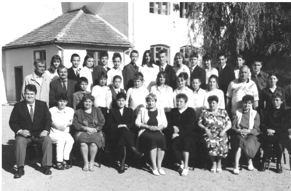
Sfârșit de an școlar. Promoția 2001-2002