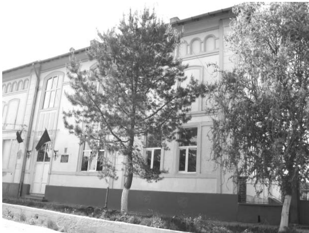
Școala Generală „Corneliu Mikloși” Covăsânt,

Odată cu evenimentele din Decembrie 1989 învățământul a suferit im-