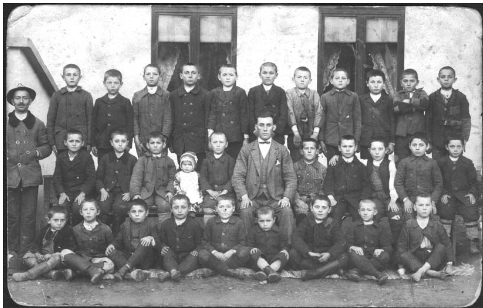
Școala de băieți din Covăsânt. 1936