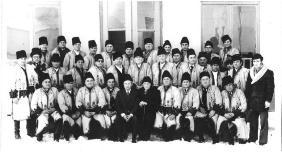
Corului din Covăsânț la 60 de ani de existență. 1983