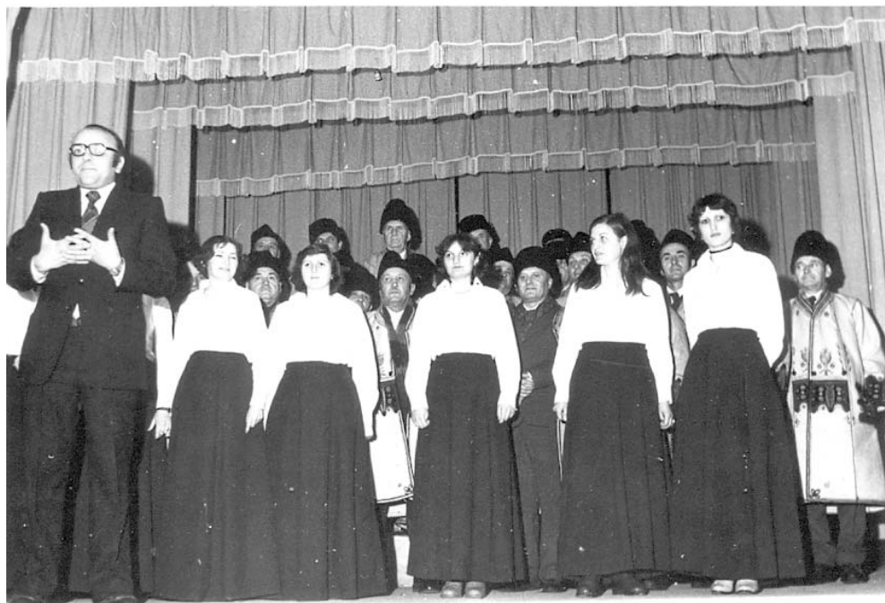
Corului din Covăsânț la 60 de ani de existență. 1983