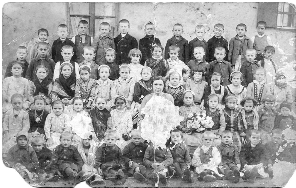
Școala din Covăsânț în perioada interbelică