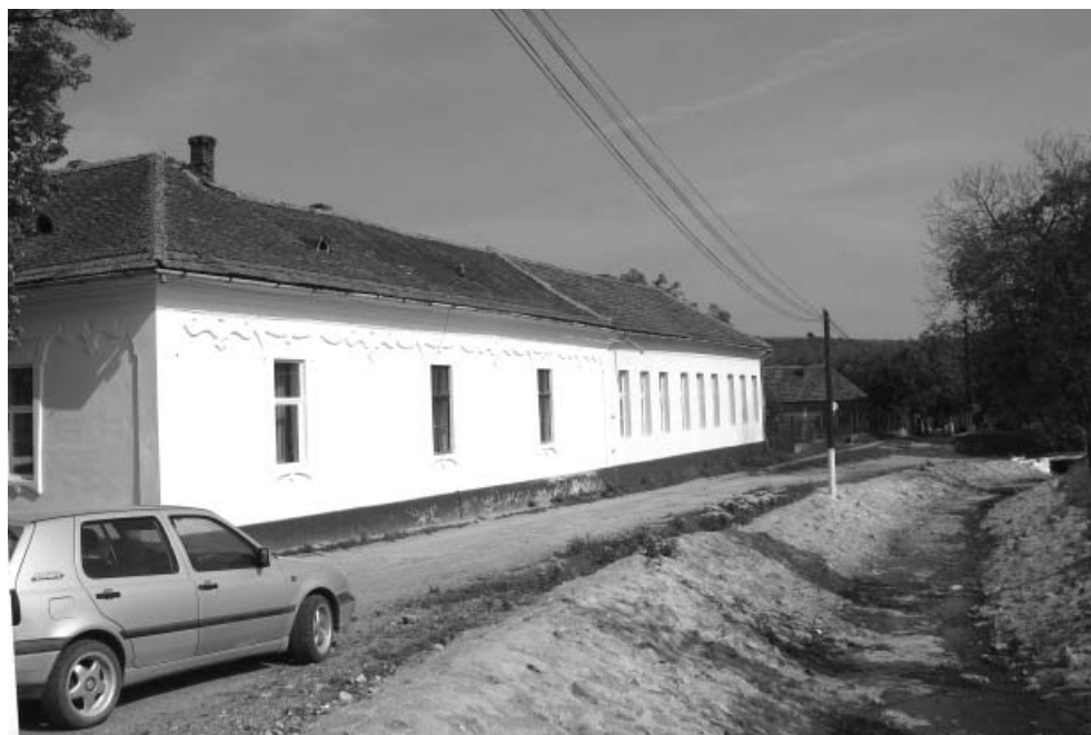
Grădinița din Covăsânț