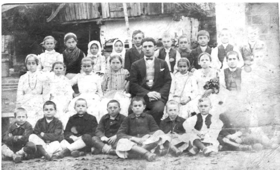
Absolvenții școlii din Covăsânt din 1920