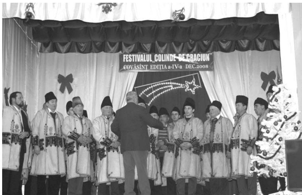
Corul "Bunavestire" al Bisericii ortodoxe române la Festivalul de colinde.