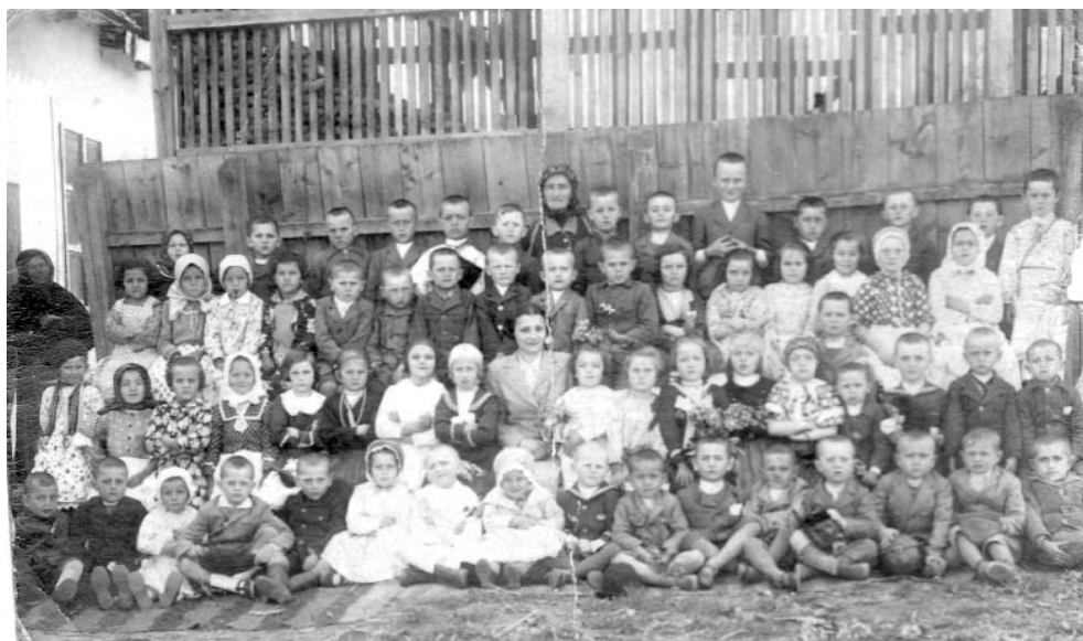
Absolvenții școlii din Covăsânt din 1940