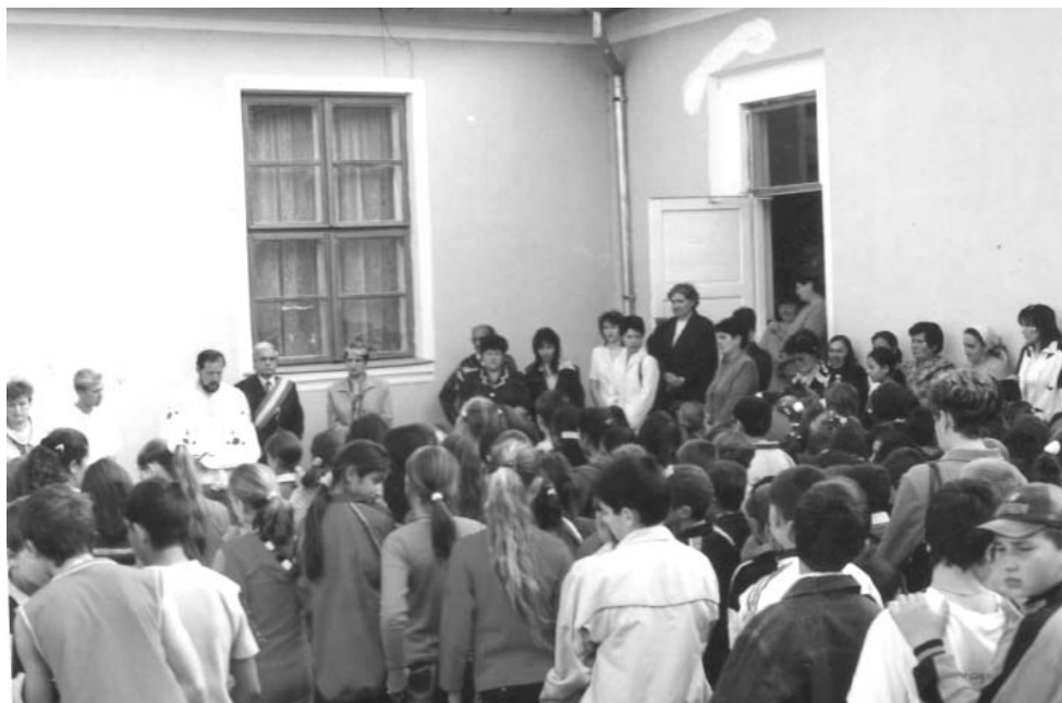
Început de an școlar