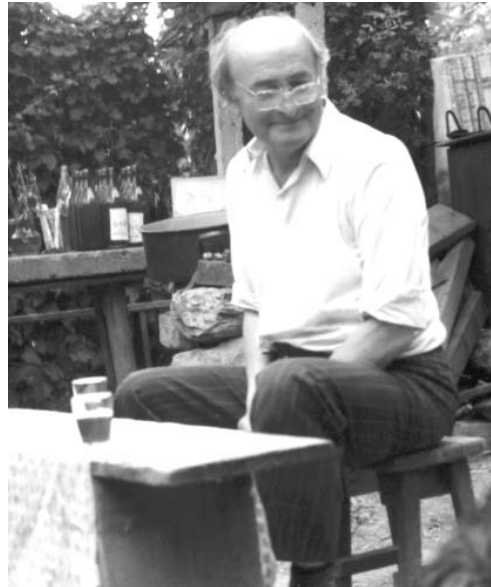
În curtea casei din Covăsânț. 2 iulie 1984