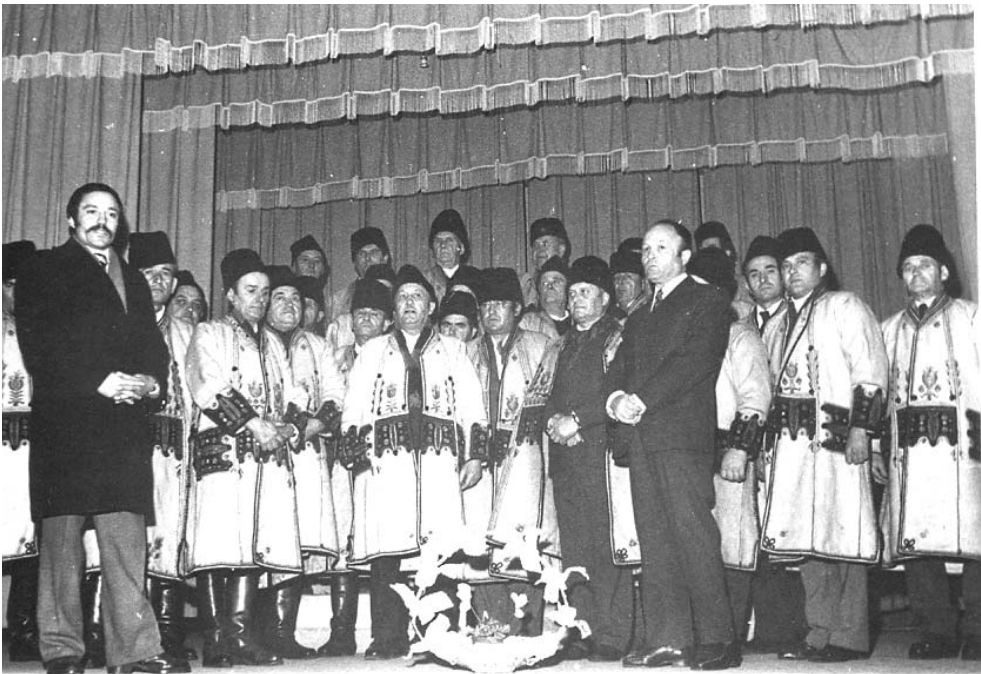
Corului din Covăsânț la 60 de ani de existență. 1983