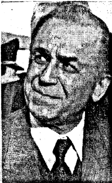
Președintele Iliescu, care deși a recunoscut că în România este o continuitate, este extrem de furios că a putut fi confundat cu Nicolae Ceaușescu.

de aproape, în ținuta de iarnă, a fost, de fapt, președintele Iliescu. Pădurarul a scuipat în sîn, uitîndu-se pe sus după cucuvele. Nua văzutu-decît pe o doamnă, pe care a recunoscut-o ulterior la televizor ca fiind Rodica Beceleanu, care îl felicita pe președinte pentru iepurele ucis. Domnul Iliescu zîmbea, însă ochiului versdat al pădurarului nu i-a scăpat agentul ascuns într-o tușă, care avea în mînă o pușcă cu țeava fumegînd, fiind adevăratul ucigaș al bietului iepure. Ion Gheorghe, care l-a votat pe Emil Constantinescu, nu a fost prea încîntat de întîlnire. Dar a fost convins de un tip solid că este bine să uite ce a văzut președintele aflîndu-se într-un mic repaus neoficial. Ceea ce pădurarul a și făcut, însă numai pînă la 1 aprilie, cînd nu a mai putut ține pentru el acest secret tulburător: cu toate a declarat că nu îi place vîntoarea, președintele Iliescu este un vîntor pasionat.