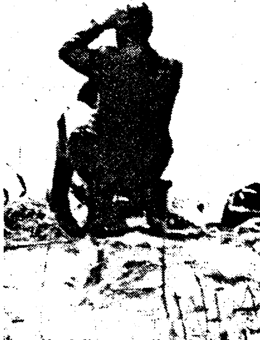
Unul din martorii oculari ai apariției submarinului unguresc, în exercițiul funcțiunii

afila în stare de ebrietate, programul său de lucru fiind încheiat, a destăinuit în bîrbînt că era să fie scufundat din greșeală de "ceva mare, care ieșea din apă, și mergea în sus către Arad". Deși nu văzuse în viața sa un submarin fluvial de spionaj, omul a desenat aproape perfect o asemenea navă. În plus, aceasta era vopsită în culorile maghiare, predominînd verdele.