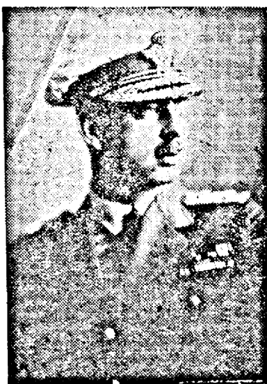
M. S. Regele Carol al II-lea