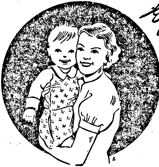
A teljes gyermekápoláshoz szükséges továbbá: NIVEA-gyermekpuder és NIVEA-gyermek-krém

Tokió. (Rador.) A DNB levelezője jelenti: A „YOMIURI SHIMBUN“ című japán lap jelentése szerint, Tokiónak tudomására jutott volna, washingtoni jólétesült körök révén, hogy az Egyesült-Államok Csendes-óceáni hajóhada elhagyta Szingapurt hogy készen álljon minden eshetőségre, az esetben ha a Távolkeleten komolyabb változások állnának be.