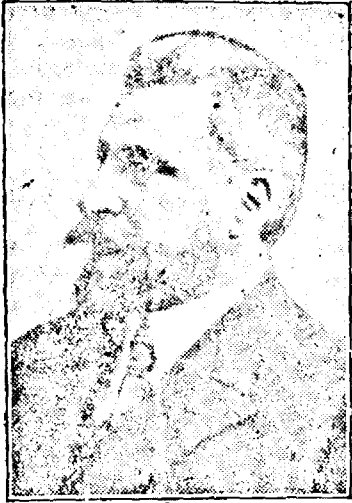
Vintilă I. C. Brătianu Șeful partidului național-liberal.