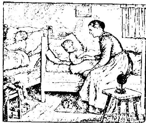
Mama la patul copilului

tea lui Dumnezeu. Puterea întunericului este biruită de mama luptătoare, care ține legătura între copil și Dumnezeu. Fierii prezenței lui Dumnezeu încep să-l strabată pe copil de mic. El se simte bine în această dragoste a mamei, dar și a lui Dumnezeu. Se obișnuiește până ce sufletul său începe să strige după Dumnezeu. Cât de aproape e Dumnezeu de copiii Săi, și cât de puternic ei îi simțese prezența, și cât de repede se roagă în inimile lor după Dumnezeu, când văd că Dumnezeu s'a depărtat de ei. Un astfel de copil e o comoară a familiei, e bucuria și fericirea familiei. Hristos începe să radieze prin el după ce a pătruns în el. Copilul rămâne copil, se joacă, fuge, face multe copilării și năzdrăvănișii copilă-