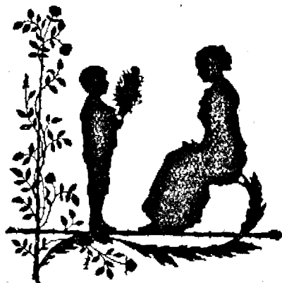
CEVA PENTRU MAMA

„ Imi aduc aminte de credința care s'a sălășluit... și în mama ta Eunice ”. II. Tim. 1:5.