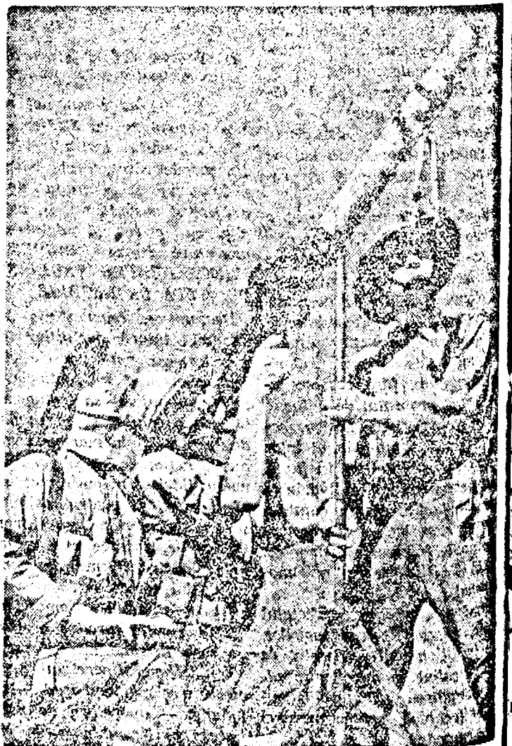
Tineri australieni făcând exerciții de trageră ahanțierie.

Credința veghează din veacuri străbună Pământul de vrajă-i scaldat O lume așteaptă cereasca minune Hristos a 'nviat!