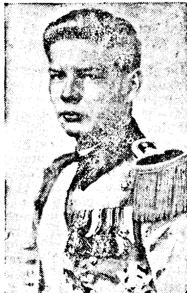
M. S. REGELE MIHAI I.

„Țara să se roage Domnului”, cerea un comunicat. Iată un lu-