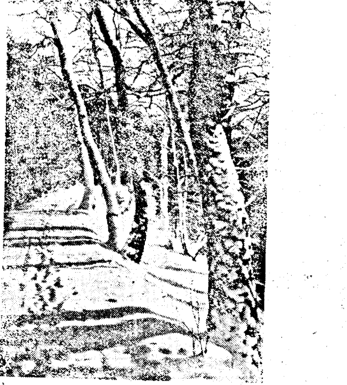
Într'o pădure germană: jocul soarelui pe zăpadă.