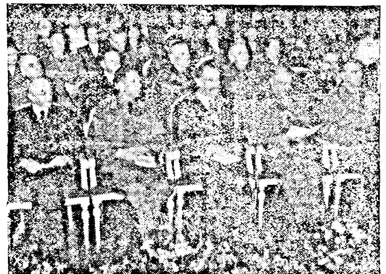
Festivitatea conducătoarelor serviciului feminin al muncii germane, la Berlin

Tehnicienii pentru instalațiile de apă din Germania și Protectoratul Boemiei-Moraviei au elaborat un plan de lucru pentru sistematizarea și folosirea forțelor hidroelectrice din Boemia-Moravia. Inițiativa urmarește în primul rând satisfacerea cererilor de curent electric, care devine din ce în ce mai mare iar pe de altă parte va căuta sistematizarea cursului apelor, în special al Elbei, și prin aceasta înlesnirea navigației fluviale. În acest plan de sistematizare a forțelor hidroelectrice este prevăzută construirea unui uriaș baraj în Boemia, care va avea o capacitate de 500.000.000 m 3 , fiind cel mai mare din Europa Centrală. Deasemenea s'a prevăzută construirea a 4 turbine, în bazinul râului Moldau, cari producând 755.000.000 kw, anual, vor putea aproviziona cu energie electrică Protectoratul Boemiei-Moraviei în mod satisfăcător.