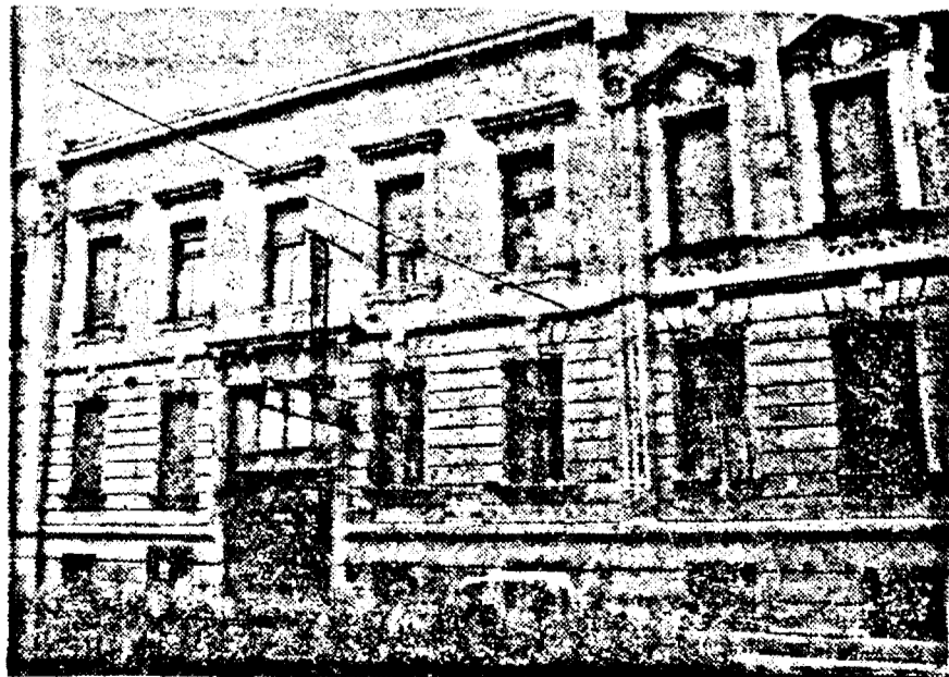
În această casă a văzut lumina tiparului ziarului „Românul”.