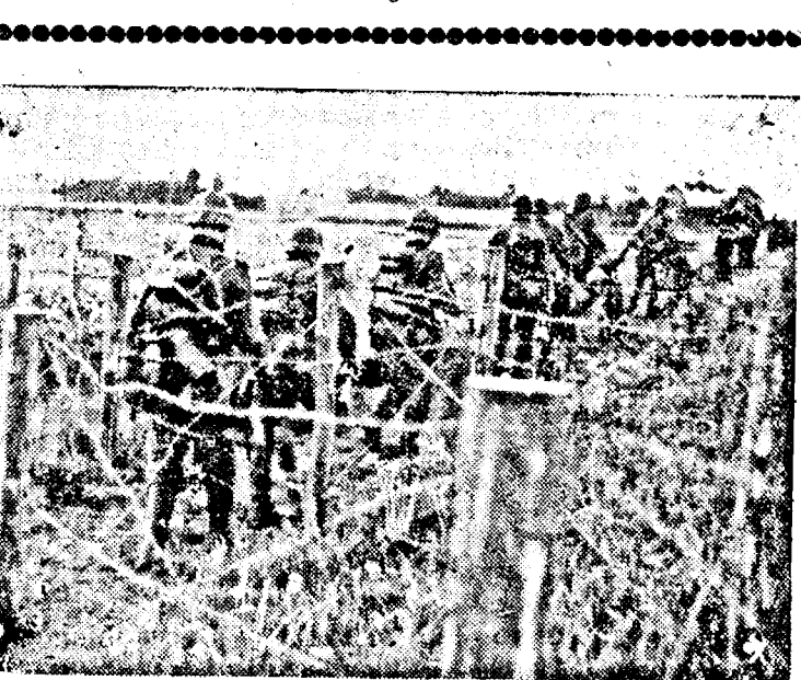
...cecare care nu pot fi obstacole pentru armata germană. Fotograf-e de pe frontul sovietic.

primul dirijabil german Zeppelin înreprinsc o că-cu pasageri în USA, pregăti-ork-ul germanilor o prim-re, cu greu se poate imagina în-rie. Treceam în mașini des-pe aceleași străzi, pe care le-ese colonelul Lindbergh, eroul-eci întregi spre care se în-ou toate înmîle și care acum-elt să restitue președintelui-velt tunica sa militară. Atunc-ă, atmosfera nu era deloc ger-ă la New-York. Resentimen-izboului mondial n'au dispă-ă totul. Așară de acesta, mai-unele grupe cari se mențineau-ă într-o adversitate plină-ă împotriva Germaniei, dar-ă simplu, apariția imensului-arg n'au pe cerul de toamnă-ă Statuei Libertății și a sgă-ărilor a captat toate înimile. ugul Zeppelinului și cei că-ă pasageri, care au avut curajul-ăcă Oceanul în aer, a fost de-ăris. Un concert de fluerături-ău ca un orcan, străzile New-ăului în timp ce noi făceam-ă deasupra orașului, și nu era-ă o sirenă, care să nu fi urlat-ă curte, un clopot de vapor, ca-ă și rămas mut. Toată lumea-ă New-York fluera pe toate to-ă și d'n sgărie nori ploua cu-ă pe jos, acoperind străzile-ătrăno pr mările cântau ameri-ă răpiți complet de moment,-ăchland-Lied și toată înimic'ia-ă înălțurată. Părea că nu mai-ăceeași oameni, care acum-ăzile vorbeau de rău Germa-ăcei care îmbrășau pasagerii-ăbilului și-l sărutau pe Knut-ăer, „în numele Americii.”