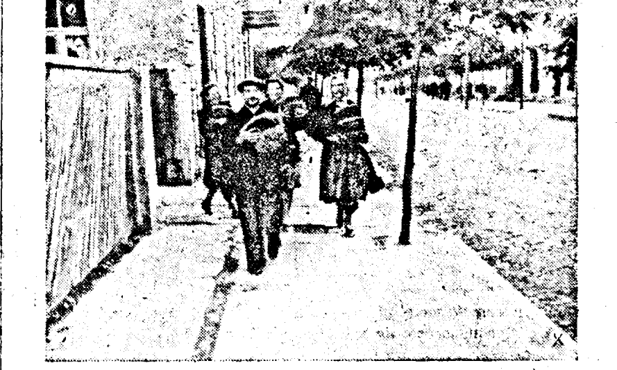
Boșevism înseamnă foamă! L'uan en' cari au pr'm't pâine dela sol-duși germani el beratori

Actele se primesc zilnic, aduse direct sau trimise prin poștă la adresa de mai sus și unde se pot lua la nevoie informațiuni de detaliu.