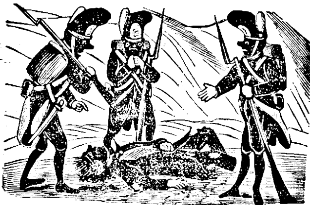
5. Dintre inimici au ramasu multi pe campulu bataliei.