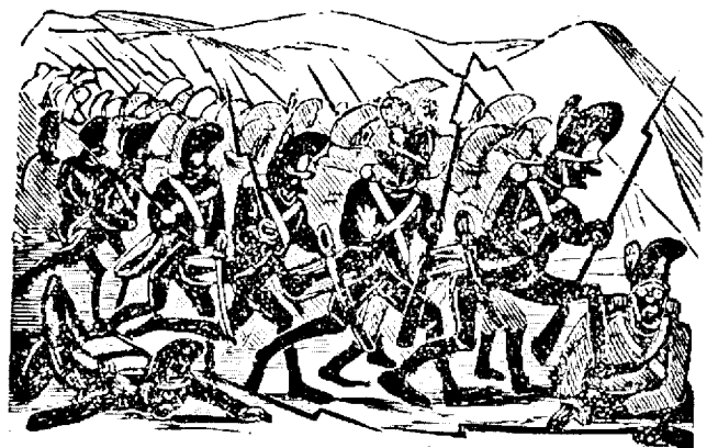
6. Ai nostri s'au retrasu incetu.

Proprietariu, redactoru respundiatoriu si editoru: Iosifu Vuleanu.