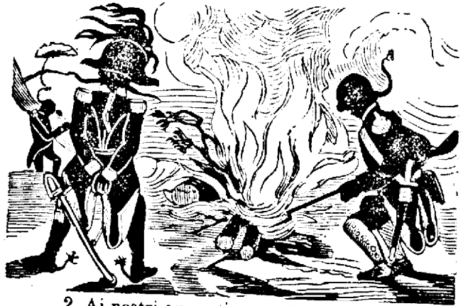
2. Ai nostri au sustienutu foculu.