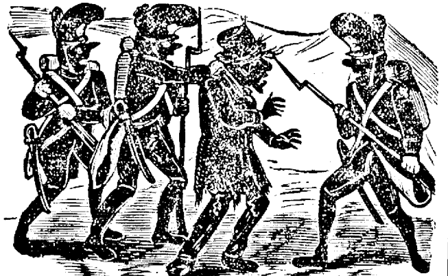
4. Amu prinsu pe unu comandante alu inimicului.